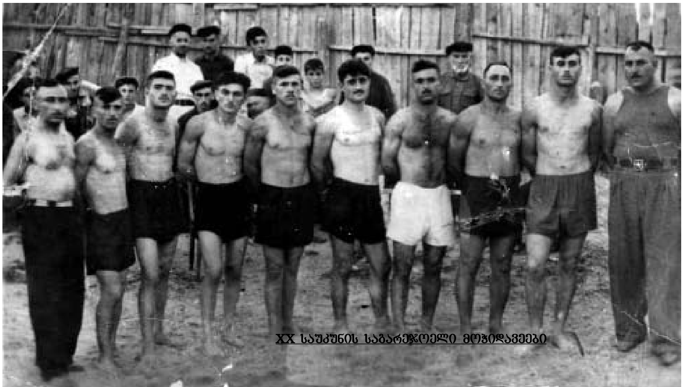
XX საუკუნის საბარჯოელი მოჭიდავეები