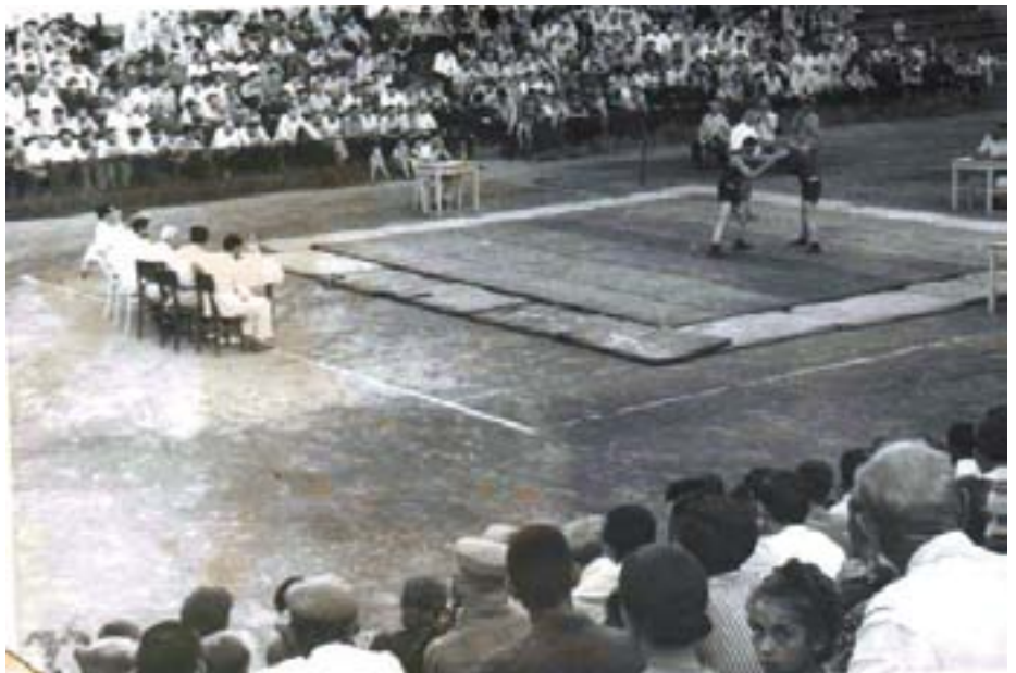
ღია სპორტული მოედანი (50-იანი წლები)