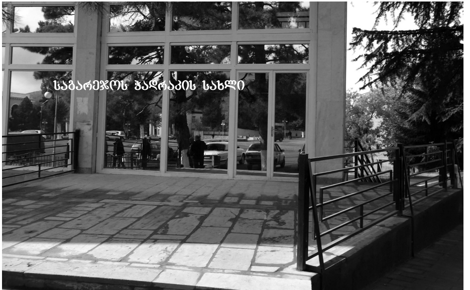
საბარეჯოს ჯალაქის სახლი

ამრიგად, ქალაქის ტერიტორიაზე არსებული სპორტული, სამედიცინო, სამართალდამცავი, საბანკო, სავაჭრო, საწარმოო, კულტურულ-გასართობი, ქრისტიანული საკულტო დანიშნულების ობიექტების სიმრავლე საგარეჯოს თანდათან სძენს თანამედროვე ქალაქის დამახასიათებელ იერ-სახეს. ამ კუთხით საქართველოს მთავრობისა და მუნიციპალიტეტის ხელმძღვანელობის ძალისხმევით განსაკუთრებით ბევრი რამ გაკეთდა და კეთდება ამ უკანასკნელი 4-5 წლის მანძილზე. იმისათვის, რომ საგარეჯოელებმა თავი კომფორტულად და ეპოქის შვილებად იგრძინონ, საგარეჯოელებმა უკვე კარგა ხანია დაიბიწვეს, თუ რა არის უშუქობა, უწყობა, რითაც მათ ბუნებრივ აირთან ერთად 24 საათიანი მომარაგება აქვთ. ყველა, ვისაც კი ამ ბოლო ხანებში საგარე-