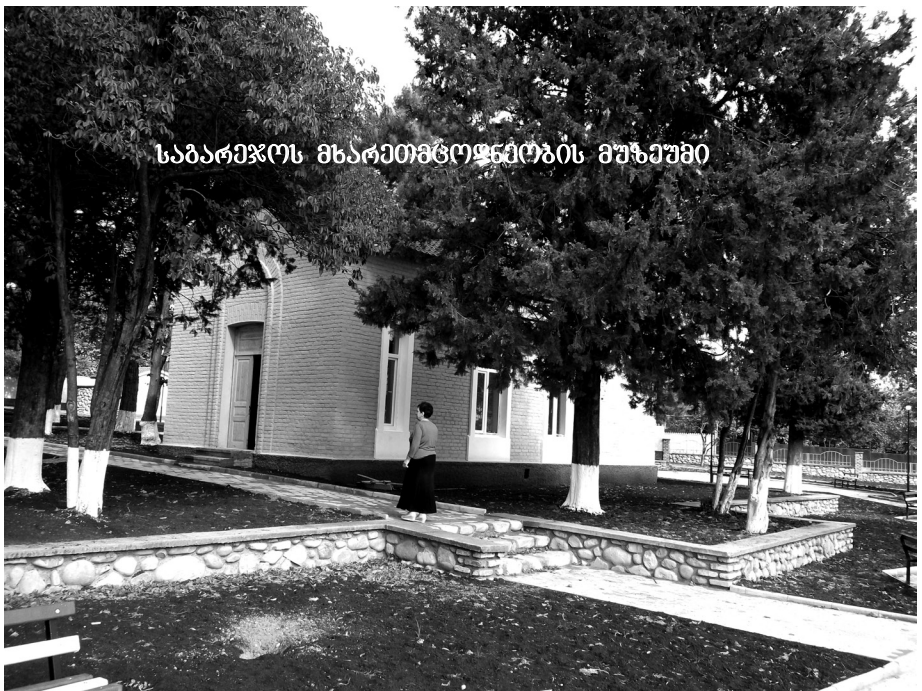
საბარეჯოს მხარეთმცოდნეობის მუზეუმი

ქალაქში მუნიციპალიტეტის ადმინისტრაციის, საეპარქო, საგანმანათლებლო თუ სხვა ორგანიზაციის დაწესებულებების სიმრავლის მიუხედავად მოსახლეობის უმრავლესობის საქმიანობის ძირითადი სფერო მაინც სოფლის მეურნეობაა – მისდევენ მევენახეობას, მემინდვრობას, მეცხოველეობას, მეფუტკრეობას, საკვებწარმოებას და სხვა. წლის დასაწყისისათვის მათ მფლობელობაში აღრიცხული იყო 6000 სული მსხვილფეხა რქოსანი პირუტყვი, 17 ათასი ცხვარი, 24 ათასი ფრთა ფრინველი, 700 ღორი, 450 ოჯახი ფუტკარი, 90 ცხენი, ჰყავთ სახეივანიც. გასაფხულის დადგომის კვალბაზე, რა თქმა