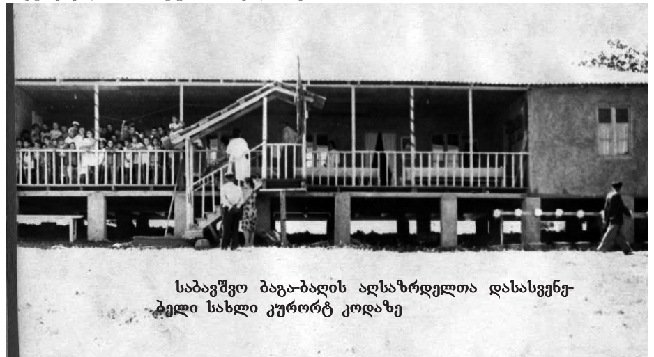
საბავშვო ბაგა-ბაღის აღსაზრდელთა დასასვენებელი სახლი კურორტ კოდაზე