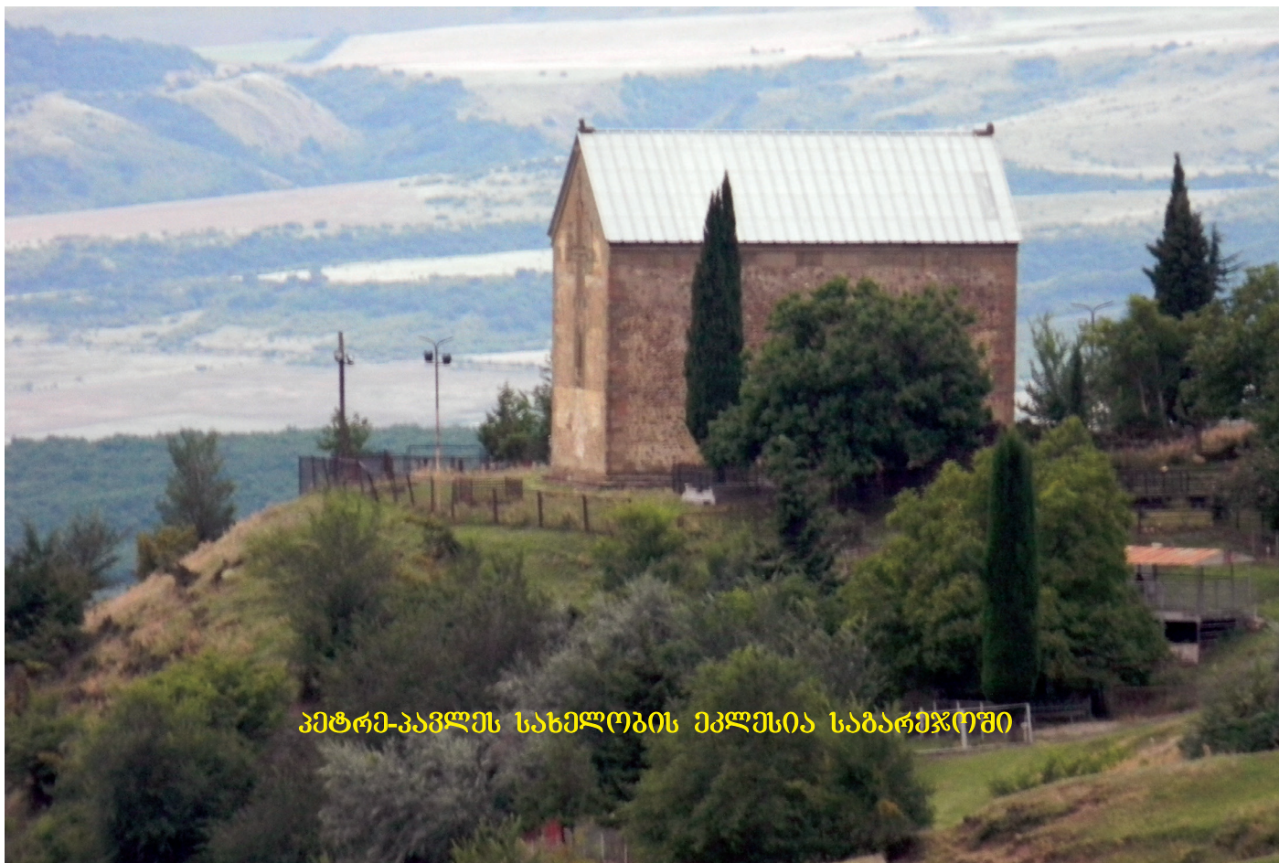
პეტრე-კავლეს სახელობის ეკლესია საბარეჯოში