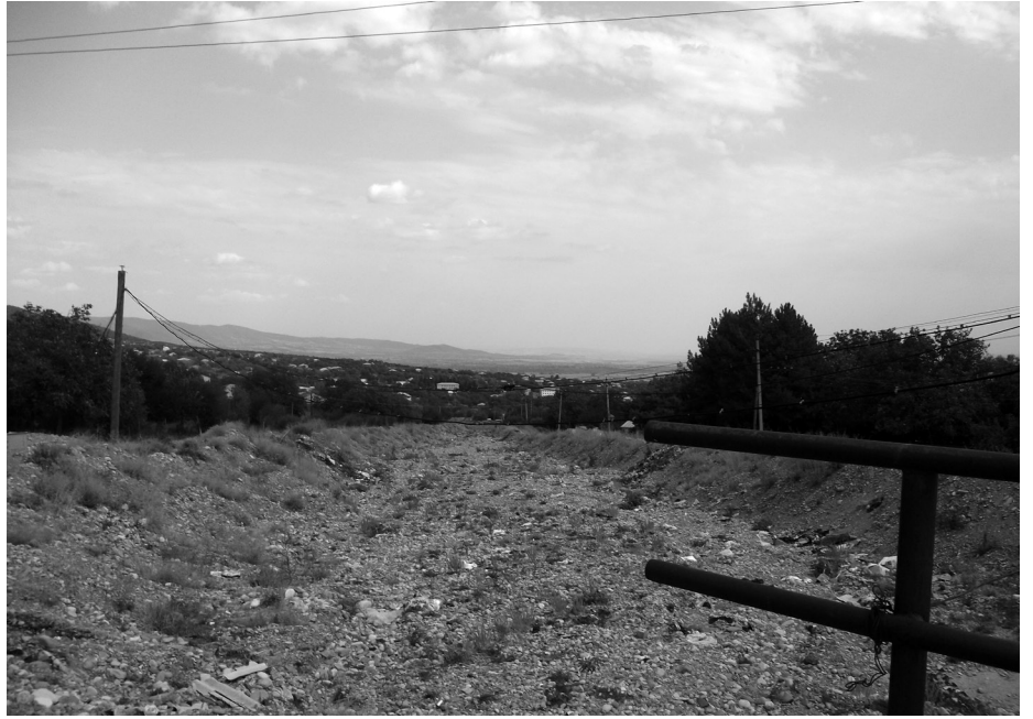
კოკონაურს, ლაპრიანსა და ნასადგომარს, გადააკვეთს კახეთის რკინიგზას და მდინარე იორს მიერთვის აგარაკ ვორულთან. □

წიფლისხევი მიედინება ჩრდილოეთიდან სამხრეთ-აღმოსავლეთის მიმართულებით, გვერდით გაუვლის აგარაკ