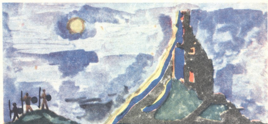
„ქაჯეთის ციხესთან“—ნახატი ზათუნა კერესელიძისა, 9 წლის, თბილისი.