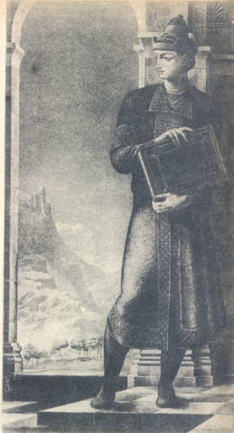
შოთა რუსთაველი ნახტი სპარო ქობულაძისა