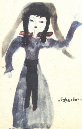
„ნეტანი“—ნახატი რუსულან ორაგველიძისა, 7 წლის, ქ. მახარაძე.