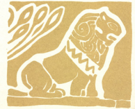
ნახატი ზამბე პანამასა

ხეც, ამ სახელოვანი წინაპრების შთამომავლები, გაათქვამული შრომა გვირგვინი, რომ ახალი, კიდევ უფრო მშვენიერი, ქართული ხელოვნება შევქმნათ და ჩვენს სამშობლოს საქვეყნოდ გაეუთქვათ სახელო.