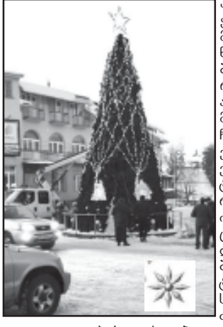
ბაკურიანში აღმართული სახალხო ხე