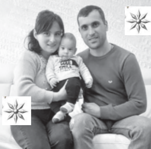
სიყვარული, ახალი წლის უკმაყოფილო!

სიყვარული კიდევ უფრო ღრმა და მყარი რომ გახდეს, შვილის არსებობა საჭიროა. მე და ჩემმა მეუღლემ ძალიან რთული გზა გამოვიარეთ. ჩვენი საფორაჟი სხვა არაფერი იყო, თუ არა ნანატრი შვილის ყოფა. ძალიან დიდი სტრესის ქვეშ ვიყავით, ვკვირდებოდით და შედეგი არ იყო.