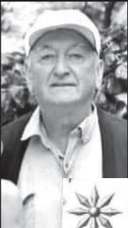
ბიზნესი, ახალი წლის უკმაყოფილო!

გაზეთ „ბორჯომის“ შემოქმედებითმა კოლექტივმა დიდი გზა გალია. 2021 წელს გაზეთის არსებობის 90 წელი შეუსრულდა. უბრალო მკითხველს ნამდვილად მემართებ, რომ მე დიდი ხანია ვთანამშრომლობ გაზეთთან, მისი აქტიური მკითხველი და კორესპონდენტი ვარ. ჩვენ სახელოვან გაზეთში 1967 წელს დაიბეჭდა ჩემი პირველი სტატია. რამდენიმე ათეული დიდი და პატარა სტატია მაქვს გამოქვეყნებული, თითქმის ყველა მათგანი შენახული მაქვს.