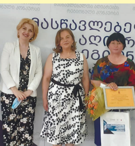
საგანმანათლებლო სივრცეში და თქვენს ზოგიერთ კოლეგას გზა გაგიკვლიათ ცხოვრების გზის არჩევასა და პროფესიულ დაოსტატებაშიც.