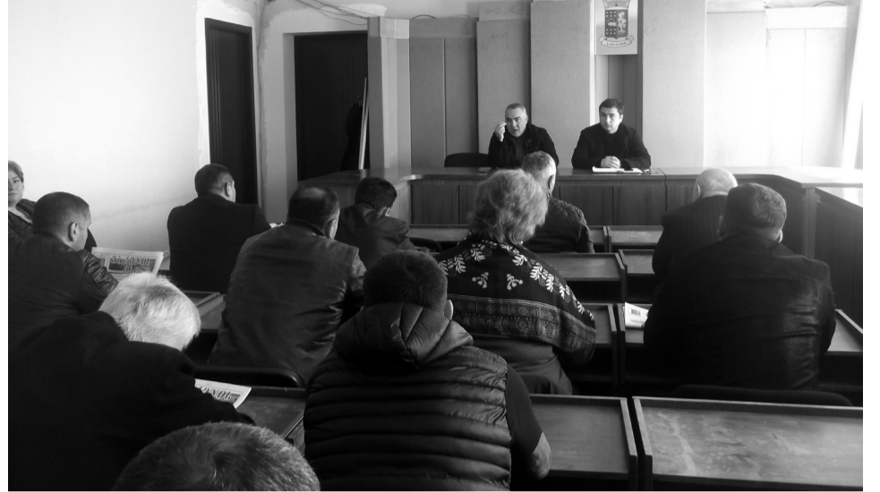
2 აპრილი, 2019 წელი