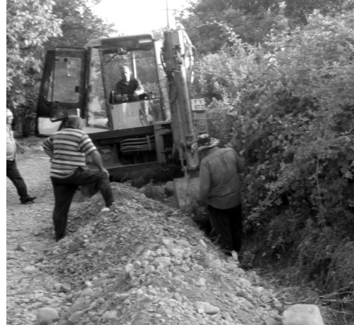
სამუშაოთაგან, აღბათ განსაკუთრებით უნდა აღინიშნოს საგარეოში კოლის გზის სარეაბილიტაციო სამუშაოები, რომლის ჩატარებამ ამ გზას დიდი ხანია სჭირდებოდა და დიდ დისკომფორტს უქმნიდა აქ დასახლებულად წამსვლელ ადამიანებს...

კოლის გზის სარეაბილიტაციო სამუშაოები ივლისში შევასრულეთ. მთლიანად შეკეთდა მისი 14 კილომეტრიანი მონაკვეთი. მისში საგარეოში რუსთაველისა და 9 აპრილის ქუჩებზე ჩატარდა მოხრეშვა-მოშენება სამუშაოები. გორგოწინდის თემში გაიწმინდა სოფელ მარიამჯვარის