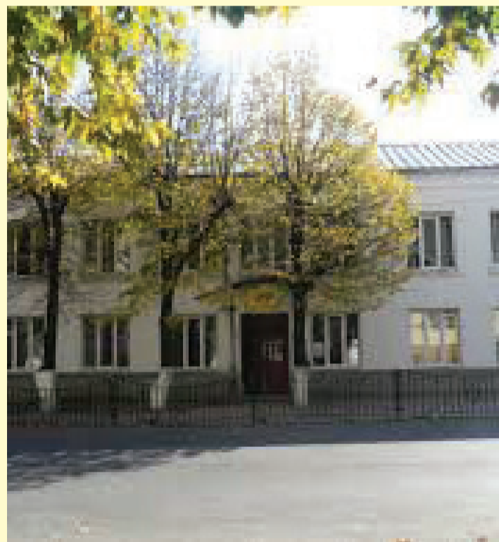
მოსწავლეთა მოლოდინში ჩამყურდრობულები