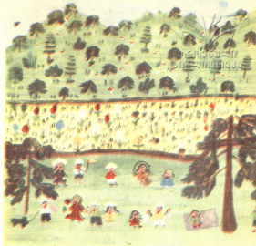
მ. თბილისის 48-ი საბავშვო ბაღის აღსაზრდელთა: კანკაბის, მჭედლის, მაკენკის და ზეჩაბიანის სახეობა.