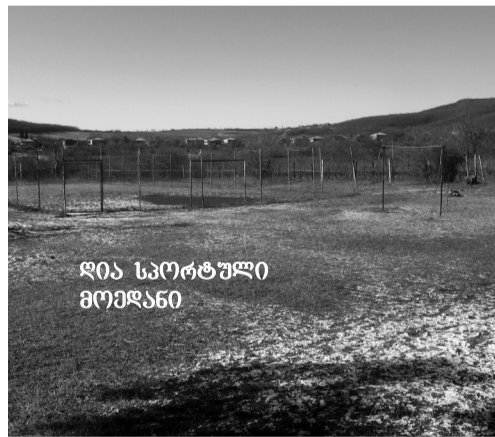
ღია სპორტული მოედანი

ამ წარმატებულ მოსწავლეებს კი, მოგეხსენებათ შესაბამისი სასწავლო პროცესი უნდა შეუქმნათ, რასაც სკოლის დირექცია და სამეურნეო საბჭო რაღაცნაირად ვახერხებთ. 2015 წელს ვაუჩერული დაფინანსებით, თანხების გარკვეული ეკონომიით სკოლის შენობაში გაკეთდა ცენტრალური გათბობა, რამაც მართლაც კარგი შედეგი მოგვცა. ამას წინ კი, 2011 წელს სკოლის შენობისათვის მეტალოპლასტმასის კარფანჯრის შეცვლა უძღოდა. სკოლის შიდა მხარე მყარად იქნა დაცული ქარის, წვიმისა და სიცივისაგან... 2010-2011 წლებში ეტაპობრივად ჩატარებულ რეაბილიტაცია. საკლა