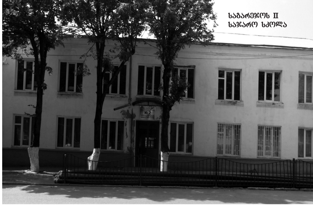
საბარძელის II საჯარო სკოლა