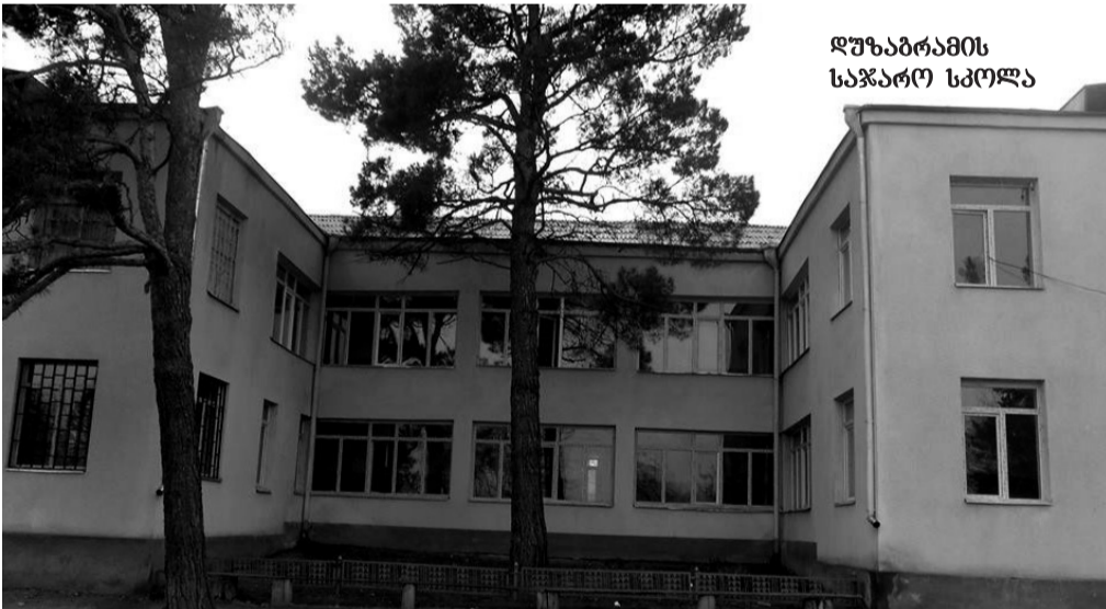
დუზაბრამის საჯარო სკოლა