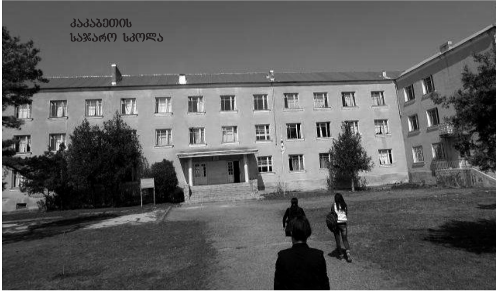
კაკაბეთის საჯარო სკოლა