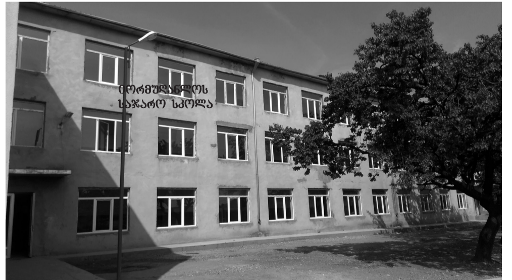
კორმჯანლის საჯარო სკოლა