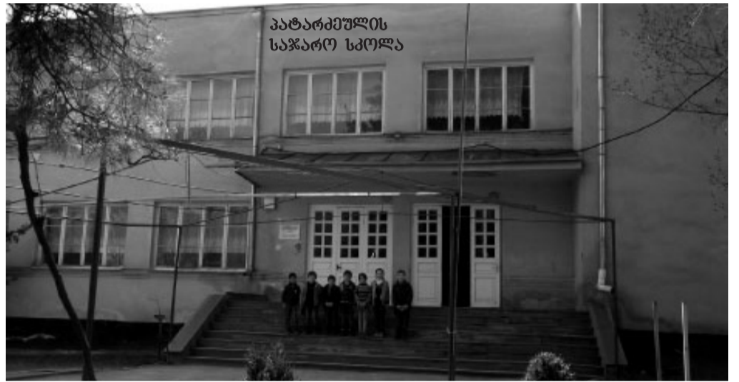
პატარძელის საჯარო სკოლა