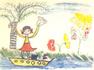
მ ი ჯ ა — ნახატი ქეთინო გველესიანისა, 6 წ. კვიბროსი.