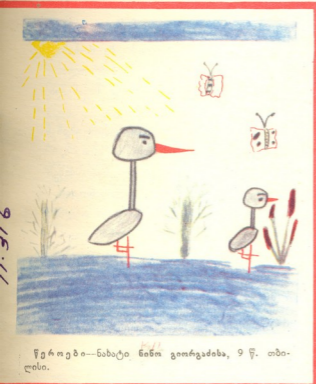
წეროები—ნახატი ნინო გიორგაძისა, 9 წ. თბილისი.