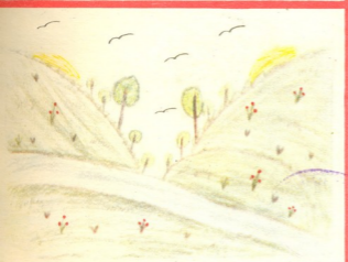
პეიზაჟი—ნახატი მანანა დავითაიასი, 8 წ. გულრიფში.