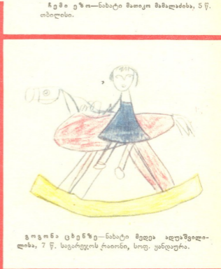
გოგონა ცხენზე—ნახატი მედეა ალაშვილისა, 7 წ. სავარჯულოს ტაიონი, სოფ. ყანდაურა.