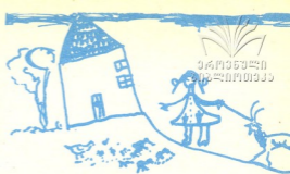
ჩემი ეზო—ნახატი შათიკო შამალაძისა, 5 წ. თბილისი.