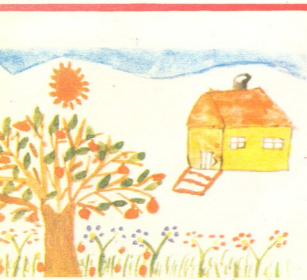
ვ ა შ ლ ი ს ზ ე — ნახატი KP ლია იმნაძისა, 6 წ. თბილისი.