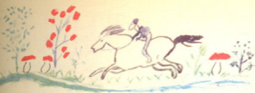
მხედარი—ნახატი თამარიკო კელიძისა, 7 წ. რუსთავი.