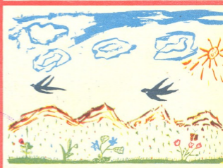
მერცხლები—ნახატი მამუკა შურმანიშვილისა, 8 წ. თბილისი.