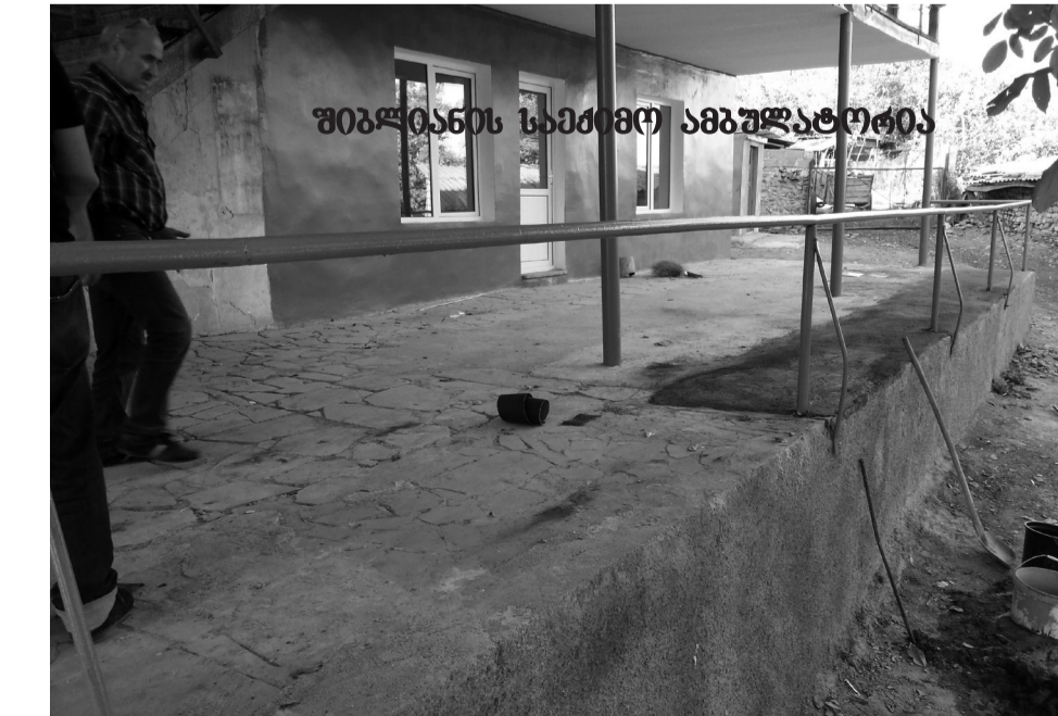
შიბლიანის სამქიმო ამბულატორია

საბარეჯოს მუნიციპალიტეტის ტერიტორიაზე ბრძანდება „სოფლის მხარდაჭერის“ პროგრამითა და რეგიონული განვითარების ფონდის მიერ დაფინანსებული პროექტების განხორციელება, რომელთა დიდი ნაწილი უკვე 80%-ითაა შესრულებული.