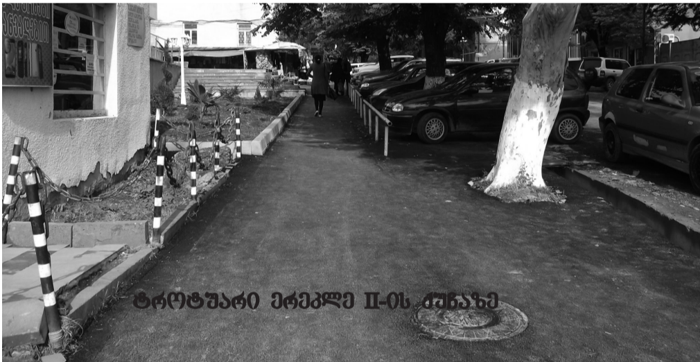
ტროტუარი ერეკლე II-ის ქუჩაზე

სოფელ ანთოკში – სასმელი წყლის რეზერვუარიდან ახალი მაგისტრალის გაყვანა და შიდა ქსელის მოწესრიგება;