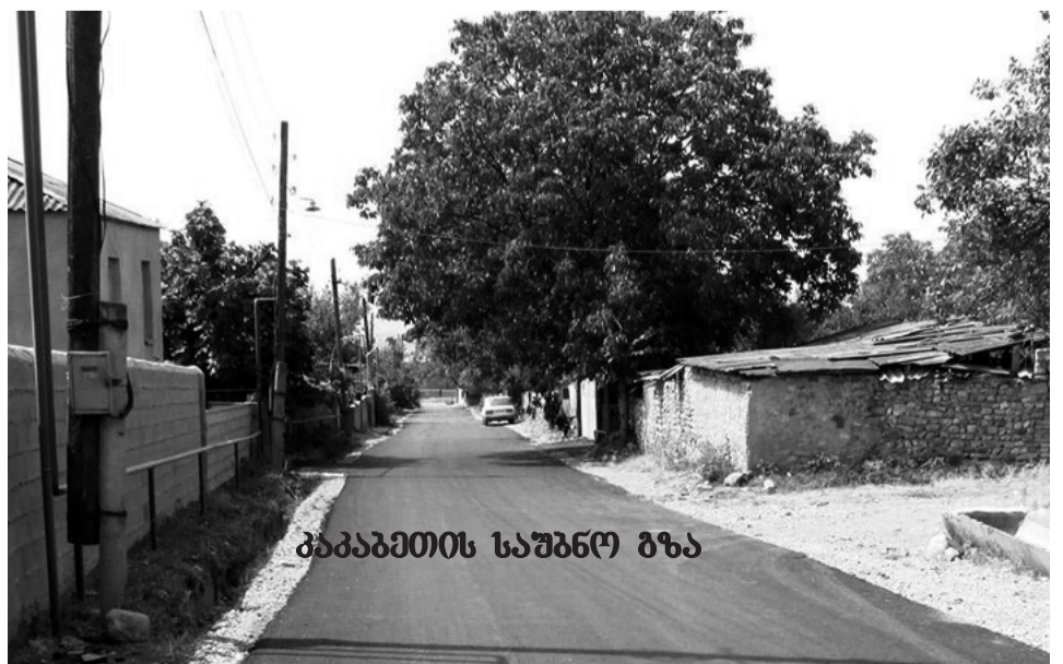
კაპაბეთის საუბნო გზა