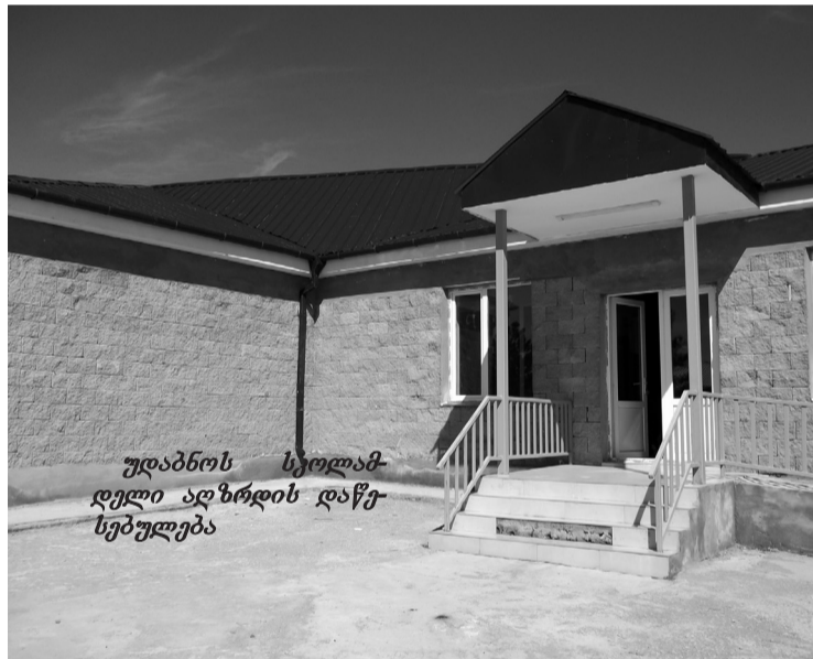
უდაბნოს სკოლამდელი აღზრდის დაწესებულება

– ნინოწმინდის სკოლამდელი აღზრდის დაწესებულების სამზარეულო.