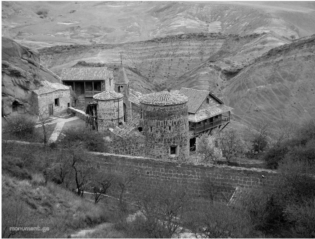
გარეჯის მონასტრებმა XIX საუკუნის ბოლომდე იარსება.

გარეჯის უდაბნო, ფეოდალური ხანის საქართველოს ერთ-ერთი თვალსაჩინო რელიგიურ-კულტურული ცენტრი, სამონასტრო გამოქვაბულთა კომპლექსი მდებარეობს თბილისიდან სამხრეთ-აღმოსავლეთით 60-70 კილომეტრზე, საგარეჯოდან კი სამხრეთ-დასავლეთით 50 კილომეტრზე. ისტორიულ კუხეთში, მდინარეების იორისა და მტკერის შორის მოქცეულ გარეჯის კლდეზე მთებში. მონასტერი დაარსებულია VI საუკუნის I ნახევარში ერთ-ერთი ასურელი მამის - დავითის მიერ.