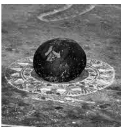
მადლის ქვა ახლა საპატრიარქოშია.

დომებია, ერთ-ერთი სვეტი მოუხსნიათ და პატარა ნიში აღმოუჩინია, ნიშზე ყოფილა ფრესკა, რომელზეც აღბეჭდილი იყო იერუსალიმიდან დაბრუნებული მამა დავითისა და მისი მოწაფის, დოდო გარეჯელის შეხვედრის სცენა. ნიშის ქვეშ სხვა ნიშანი იპოვეს. იქ ინახებოდა იერუსალიმიდან ჩამოტანილი ქვა-მადლის ქვა-ბატის კვერცხზე ოდნავ მომცრო, მოწითალო-მოშინდისფრო და ალაგ-ალაგ სისხლის კვალი ატყვია. 1857 წელს მონასტერს ლეკები დასხმიან თავს, ზოგი ამოხოცეს, ზოგი ტყვედ წაიყვანეს. ხელს გააყოლეს ღუსკუმაში ჩაბრძანებული მადლის ქვაც. მათ ქვის მნიშვნელობა არ იცოდნენ და ერთ-ერთ ლეკს სახლის სხვენში შეუნახავს. ეს დაუმახსოვრებია ტყვედწავარდნილ ბერს და როცა ტყვეობიდან განთავისუფლდა, მოიპარა ის ქვა და დავით გარეჯაში დაბრუნდა.