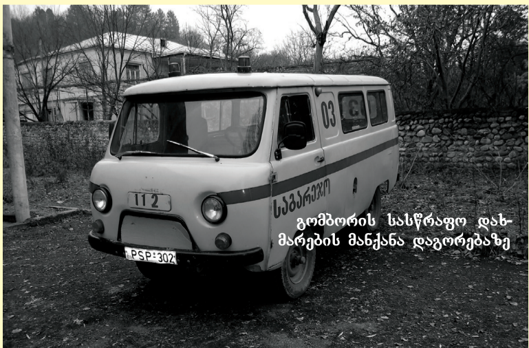
გომბორის სასწრაფო დახმარების მანქანა დაგორებაზე