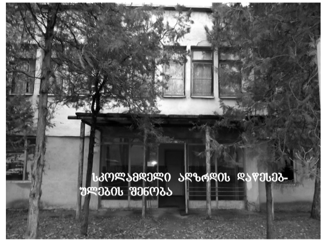
სკოლაშვილი აღზრდის დაწესებულების შენობა

დაწესებულება დგას, რომელიც შიგნიდან-გარედან გარემონტებულია, მაგრამ იმდენად დაზიანებული კედლებით, რომ შიგნით აღსაზრდელების შეყვანა მეტად სარისკოა. ამასთან სატირალია თუ გასაცინი, იმასაც ვერ გავარკვევთ, თუ ვიტყვი, რომ კანალიზაციის სისტემა ისეა მიერთებული შენობასთან, რომ საკანალიზაციო ჭა უფრო მაღლაა, ვიდრე შენობის იატაკი?! დღეს შენობა, რომელიც 2012 წელს აშენდა და 60 ათასზე მეტი ლარი დაჯდა, დაკონსერვებულია! თუმცა, თამამად შეგვიძლია ვთქვათ, რომ კომუნისტების მიერ შეკვიდრად აშენებულ, მაგრამ უკვე მოძველებულ შენობაში აღსაზრდელებს