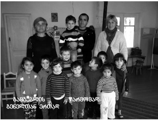
ბავშვების წარმომადგენლებთან ერთად

თვალსაზრისით უმთავრესი სამეცადინო ოთახში შესულებს პატარები, ცნობისმოყვარე თვალებით გვათვალისწიებენ, მაგრამ შევნიშნე, მეგობრულად უდიდობან და რაღაცეებს ანიშნებენ ჩემს თანხლებს – გამგებლის წარმომადგენელს. როგორც ჩანს იცნობენ და უბრალოდ ჩემი „ერიდებათ“ მასთან გასაშინაურებლად. მაგრამ, როცა სურათის გადაღება შევთავაზე მათ, აქეთ-იქიდან ამოუდგნენ ძველ ნაცნობს და ერთად გადადგნენ