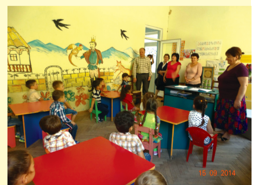
საბარეჯოს №3 სკოლაგდელი აღზრდის დაწესებულება