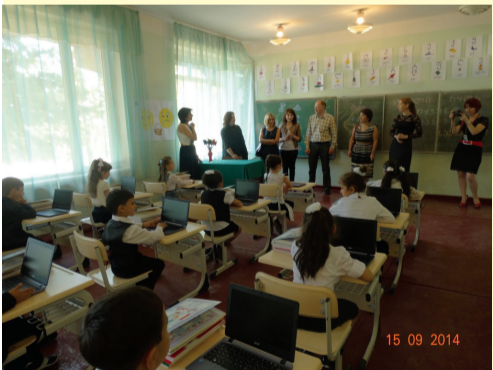
საბარეჯოს III საჯარო სკოლა