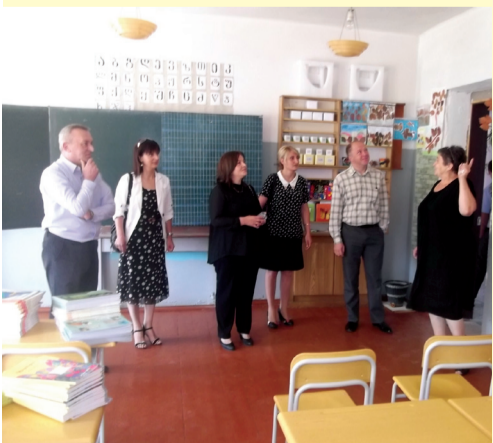
საბარეჯოს IV საჯარო სკოლა