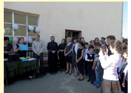
ბიორბიჭინდის საჯარო სკოლა