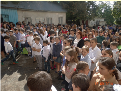
საბარეჯოს II საჯარო სკოლა