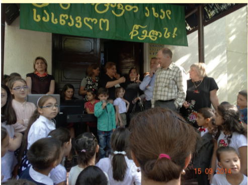
საბარეჯოს I საჯარო სკოლა