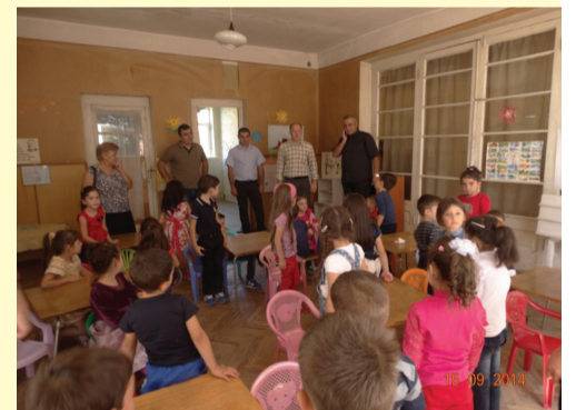
ბიორბიჭინდის სკოლაგდელი აღზრდის დაწესებულება