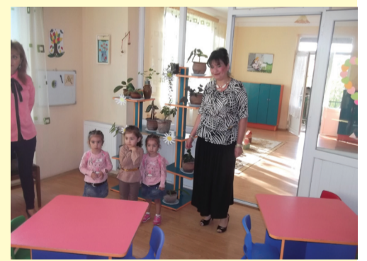
საბარეჯოს №1 სკოლაგდელი აღზრდის დაწესებულება