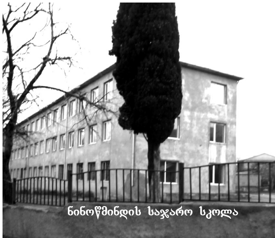
ნინოწმინდის საჯარო სკოლა

ჩვენ ისევე მოგვეწოდება ელექტროენერჯია, როგორც სხვა დანარჩენ სოფლებს, საგარეჯოს. სოფელში მთლიანად მოხდა მოსახლეობის გამრიცხველიანება და დღეს აქ 476 ელექტრომომრიცხველია. ასევე, ბუნებრივი აირით სარგებლობს 466 აბონენტი.