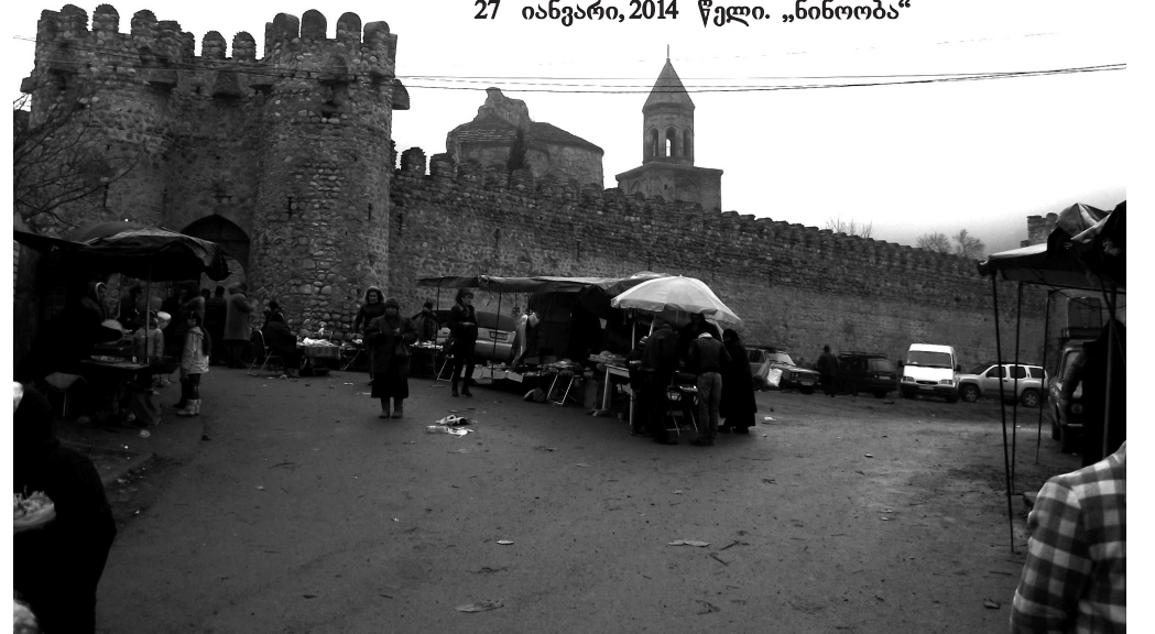
27 იანვარი, 2014 წელი. „ნინოობა“

ჰა კერძო მფლობელობაშია, 315 ჰა მუნიციპალურია, ხოლო 585 ჰა – სახელმწიფო-ისა. სოფელში მრავალწლიან ნარგავებს 298,5 ჰა უკავია და მთლიანად კერძოა.