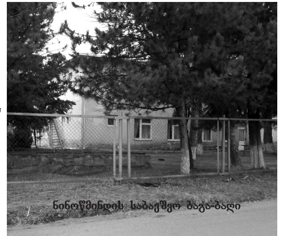
ნინოწმინდის საბავშვო ბაგა-ბაღი