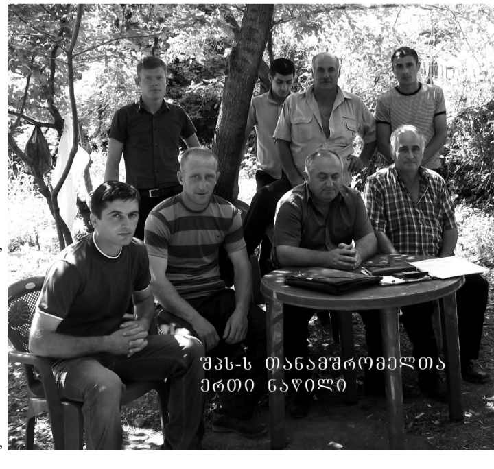
შპს-ს თანამშრომელი ერთი ნაწილი

ჩვენს ცენტრში არსებულ ტექნიკას ყველა იმ სამუშაოს შესრულება შეუძლია, რაც მიწათმოქმედებასთან არის დაკავშირებული: ნიადაგის მზრუნველ და ანეულად მოხვნა, ნიადაგის ღრმად დამუშავება, ნასვენი მიწების მოხვნა, რაც სწორედ ამ გაზაფხულზე მასიურად განხორციელდა, ხნულის დაფარცხვა, დადისკვა, ხნულის ვერტიკალურად ფრეზირება და შესაბამისად, ნიადაგის მოსწორება, ვენახის ფრეზირება, სასუქის შეტანა, საშემოდგომოდ და საგაზაფხულო თავთავიანი კულტურების თესვა, მოსავლის აღება, ნათეს-ნარგავების ჰერბიციდებით დამუშავება, ვენახების და ბაღების წამლობა, არხის გაჭრა, ხარწყავი მილის გაშლა, ბაღახის თიბვა, დაწნევა და ა.შ. ამ ოპერაციების ხარისხიანად შესრულებას