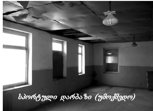
სპორტული დარბაზი (უმოქმედო)

ბაბა-ბალის შენობა, ეხო-გარემო მართლაც რომ ძალიან კარგია, მაგრამ შენობას, თქვენ თავად ნახეთ, რამდენი რამ სჭირდება. მართალია თებერვალ-მარტში საბავშვო ბაბა-ბალის სახურავი მუნიციპალიტეტის გამგეობის მიერ ახალი გადახურვით შეიცვალა (რამაც შეაჩერა წვიმის და თოვ-