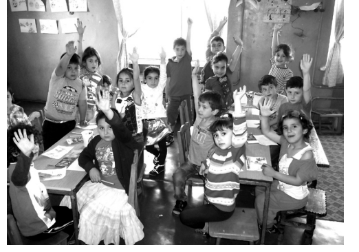
„ჩვენ სექტემბერში სკოლაში მივდივართ“

სრობის გამო გამოკეტილი), ან საგარეო სხვადასხვა ბაგა-ბაღებში დაჰყავთ მშობლებს. ერთი მარტივი მიზეზების გამო: ბაგა-ბაღში დღესდღეობით არ არსებობს სანიტარულ-ჰიგიენური პირობები, მატერი-ალურ-ტექნიკური ბაზა.