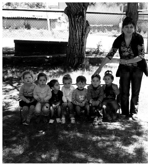
34 წლიანების ჯგუფი - შუაღლის ძილს თავს არიდებენ

აუცილებლად უნდა გამოსწორდეს, რადგან სკოლამდელი აღზრდის დაწესებულებებს დიდი მისია აკისრიათ მომავალი თაობების აღზრდა-განვითარების საქმეში. სექტემბრიდან მუნიციპალიტეტის ყველა სკოლამდელი აღზრდის დაწესებულება ახალი სასწავლო პროგრამით იწყებს მუშაობას, რომელსაც კარგი მატერიალურ-ტექნიკური ბაზა სჭირდება.