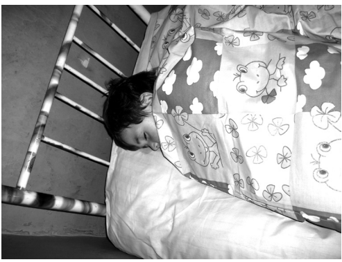
ნიკოლოზ შუაღლის ძლიერ სძინავს