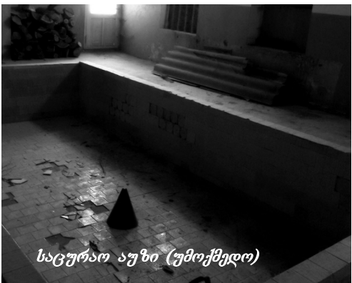
საცურათ აუზი (უმოქმედო)

ბაბა-ბალოში ბუნებრივი აირის შემოყვანა 1700 ლარი დაჯდა, მაგრამ იძულებული ვიყავით სამხარეულოსთვის შემოგვეყვანა. ოთახებს ზამთარში შეშის ღუმელებით ვათბობთ. ჩვენი აღმზრდელ-მასწავლებლები ყველანაირად ცდილობენ აღსაზრდელს მისცენ ის, რაც სკოლამდელი აღზრდის