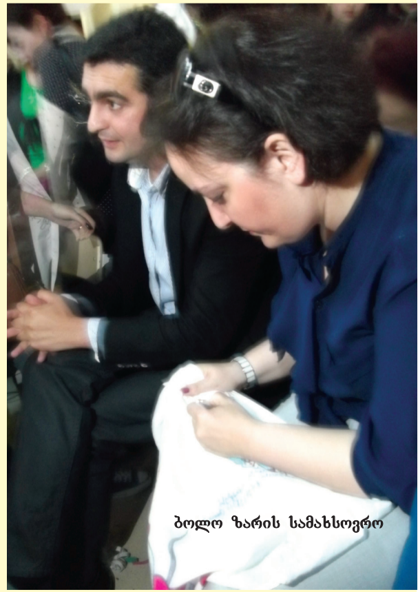
ბოლო ხარის სამახსოვრო