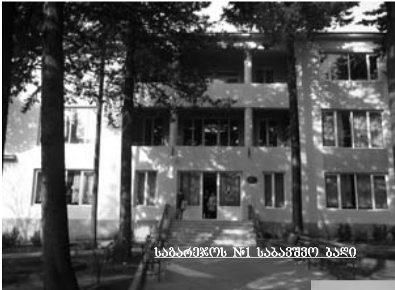
საბარეჯოს №1 საბავშვო ბაღი

ს ა პ ა რ ლ ა - მენტო უმცირესობის წევრი სერგო რატიანის განცხადებით, საქართველოში ბავშვის რაოდენობა მხოლოდ მოთხოვნის 60 პროცენტს აკმაყოფილებს. მისივე თქმით, არ არსებობს