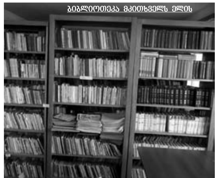
ბიბლიოთეკა მკითხველს ელის

ნამუშევარი ხელოვნების ნიმუშამდე აყვანილი. ჩემი აზრით, კარგი იქნება თუ თავად ადამიანებს მოეუხმენტ და ისე დაევიწყებთ საერთო საქმეს. გაზაფხულდა. ახლა ბევრი რამა გასაკეთებელია: მოსახლნავე, დასათვისი. მთავრობის მიერ სასოფლო-სამეურნეო ბარათების დარიგებამ გამოაცოცხლა ხალხი. როგორც ვთქვით, სოფელში აუცილებელია გზების მოხრეშვა, ხიდების შეკეთება, მოსაწესრიგებელია სასმელი წყლის სისტემა. როცა ინფრასტრუქტურა თავის სახეს მიიღებს, მაშინ ადვილია მიგრაციის შეჩერებაზე საუბარი.