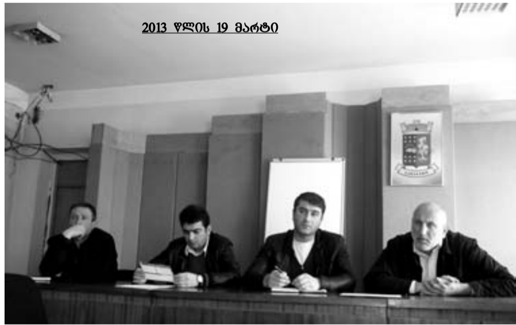
2013 წლის 19 მარტი

როგორც ტერიტორიული ორგანოების რწმუნებულებმა აღნიშნეს, და ეს საკითხი ქალაქის რწმუნებულმა გიორგი ქვლივიძემ პირველმა წამოჭრა, სასაფლაოებთან მისასვლელი გზები საკმაოდაა დაზიანებული. აღნიშნული გზები მძიმე ტექნიკის სერიოზულ მუშაობას მოითხოვს. მუნიცი-