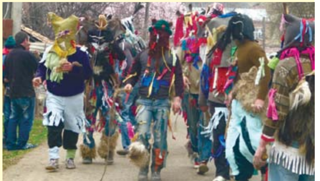
ჩვენი ხელუფლებითაა გავითარებთ ჩვენს სოფლებს

საგარეჯოს მუნიციპალიტეტის გამგებლის პრესსამსახური