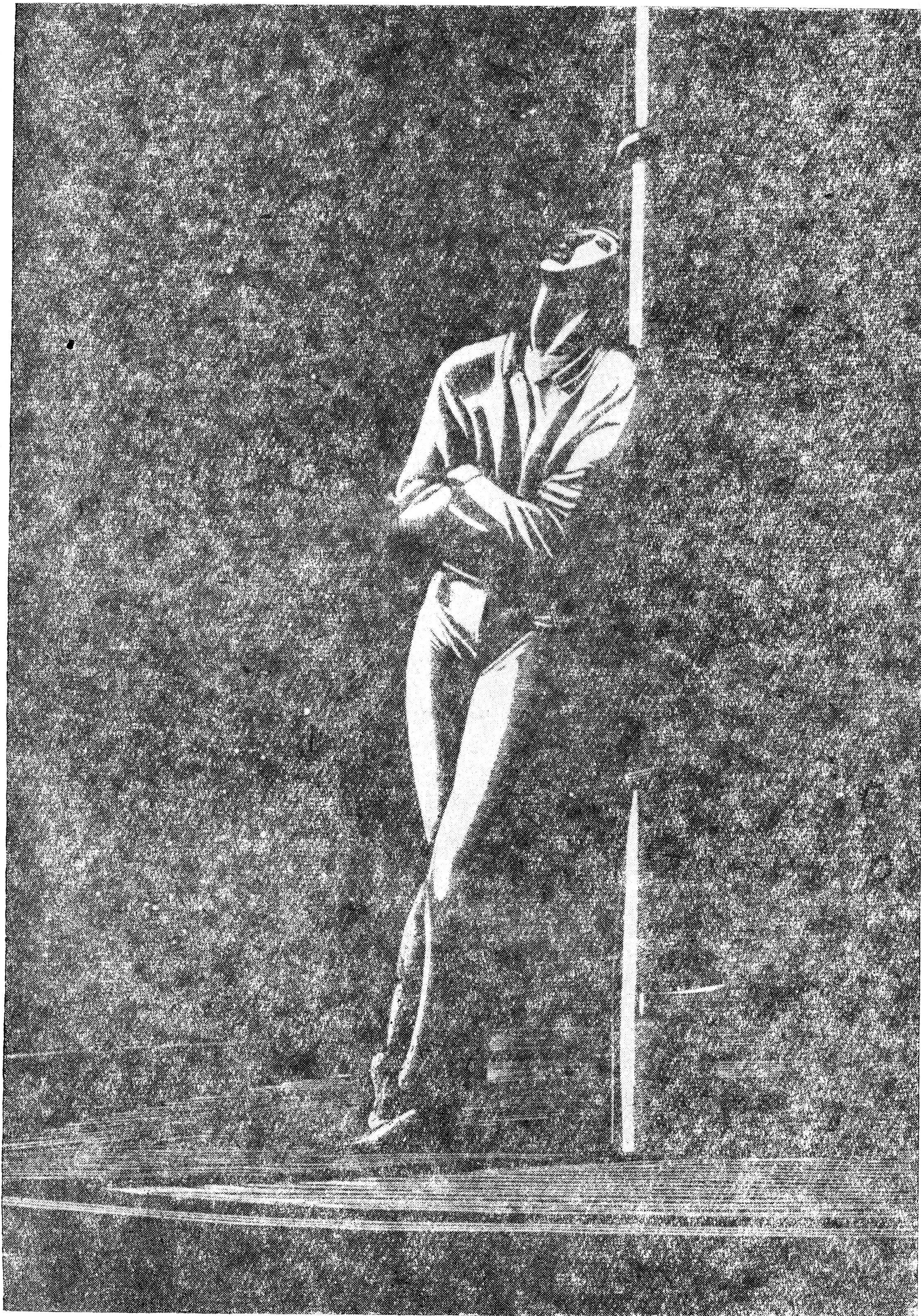
როკუმელ კენტი. „აღამიანი ანძასთან“.