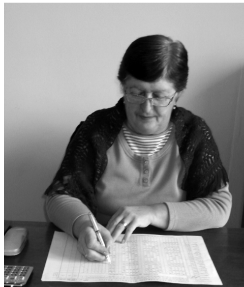
აღსაზრდელი – 12 მოსწავლეებელი – 1

დიდი ჩაილურის არაერთი სკოლამდელი თაობა აღიზარდა, იმდენად ავარიული და მოძველებული იყო, რომ მშობლებს ეშინოდათ კიდევ ბავშვების იქ მიბარების... ძველი შენობა 1956 წელს იყო აშენებული.