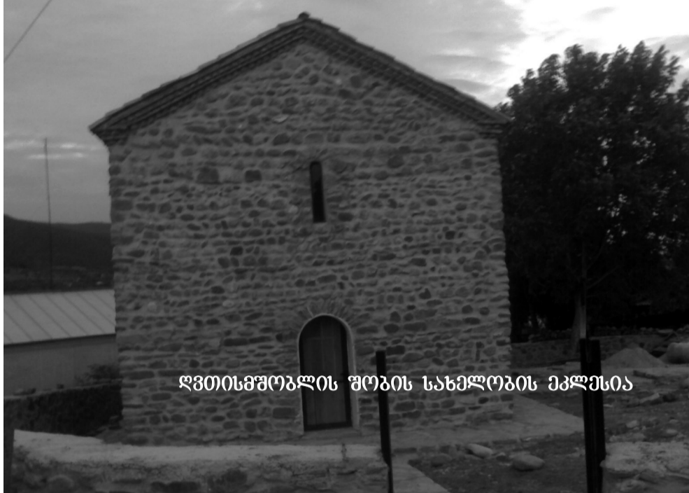
ღვთისმშობლის შობის სახელობის ეკლესია

ჩაილურს გარე კახეთის ერთ-ერთ უღამაზეს და ეკონომიურად მძლავრ სოფელს საგარეჯოს რაიონში თავისი ხელწერა აქვს. იგი მანათთან და კაკაბეთთან ერთად მევენახეობა-მეღვინეობის განვითარების მძლავრ კერას წარმოადგენს. ამ სოფელს თავისი სახელგანთქანი წარსულით დიდი ისტორიაც შეუქმნია და დღევანდლამდე მოუტანია. თუმცა თავისი არსებობის გრძელ მანძილზე გამანადგურებელი ბრძოლებიც გადაუტანია. მის უბეკალთებზე დღემდე შემორჩენილი თავდაცვითი, საფორტიფიკაციო ციხე-სიმაგრეების დიდებული ნაშთები მისი უტყუარი ისტორიის მაუწყებელი არიან.