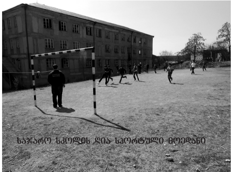
საჯარო სკოლის დია სკორტული მიწა

დასრულდა. ამ ბრძოლაში სასიკვდილოდ დაიჭრა თვითონ ომარ ხანი და სარდალი ჯანმუტაი. ეს იყო რუს-ქართველთა ბრწყინვალე გამარჯვება, რომელსაც სარდლობდნენ გენერლები ლახარევი და გულიაკოვი, ქართველი უფლისწულები იოანე და ბაგრატ ბაგრატიონები.