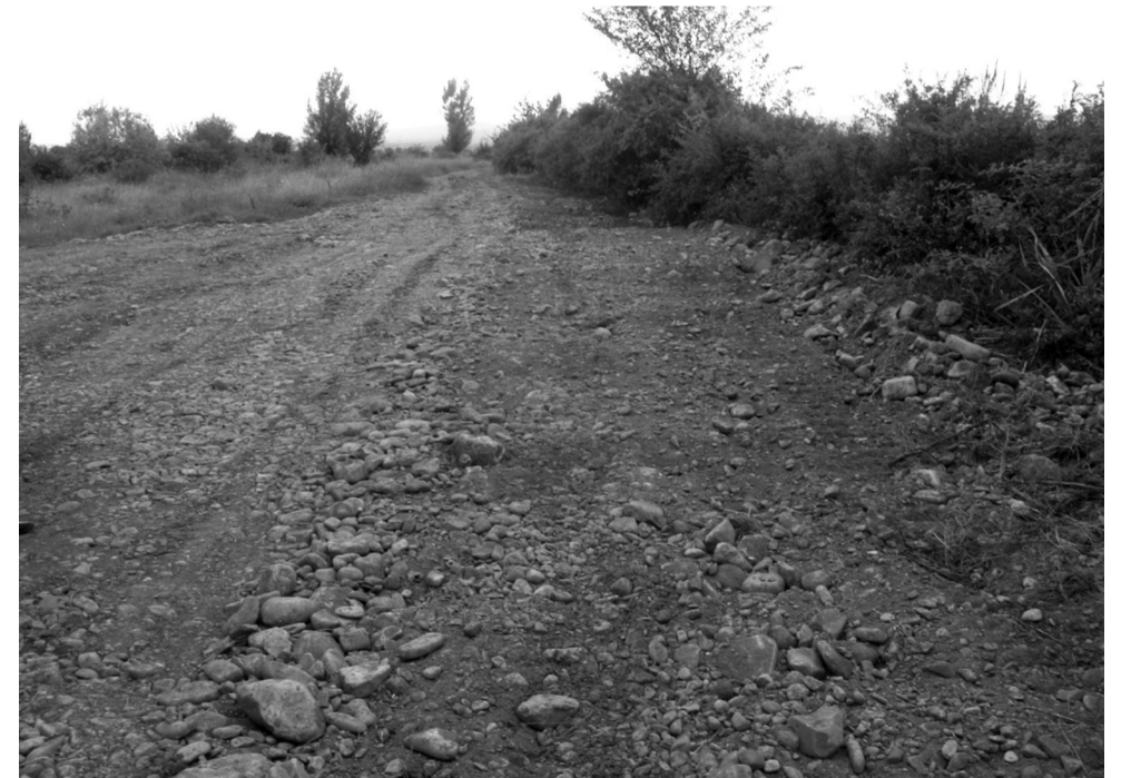
კაკაბეთის სავარგულეზამდე მისასვლელი გზა