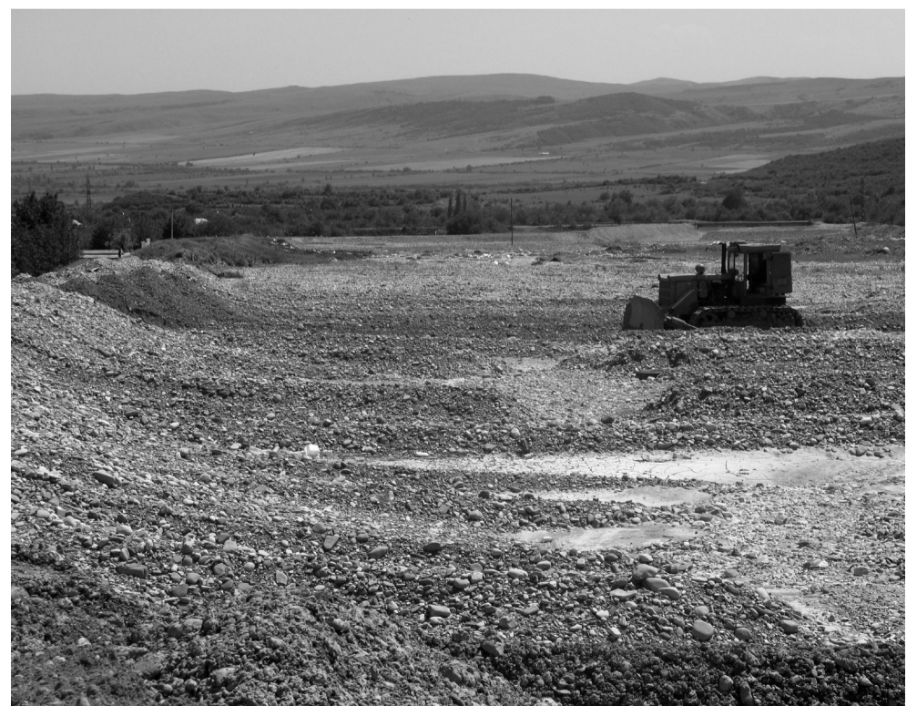
თვალთხევის გაწმენდის სამუშაოები