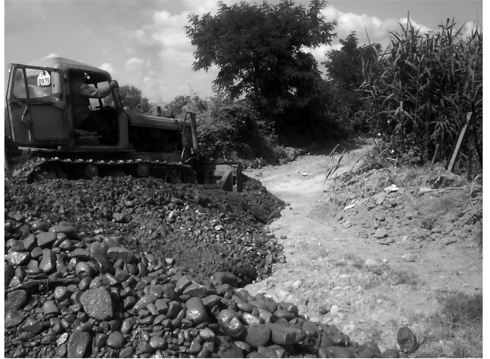
მანავის სავარგულეზამდე მისასვლელი გზა