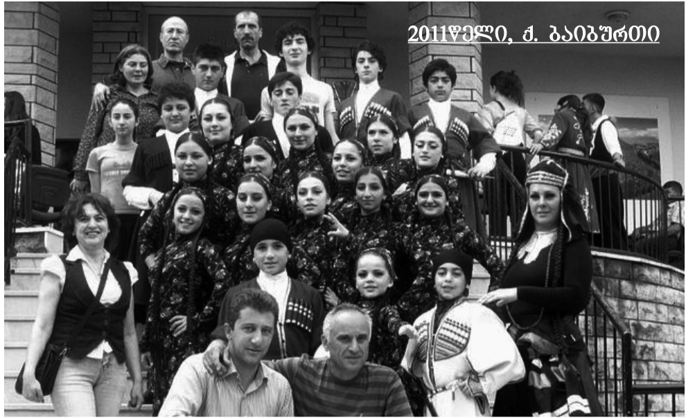
2011წელი, ქ. ბაიბურთი

ამ ფესტივალში და ისე შეყვარეს და დაამახსოვრეს თავი ბაიბურთელებს, რომ თითქმის ზეპირად იციან ანსამბლის ყველა წევრის სახელი. წელს, როცა ზოგიერთი მათგანი ვერ წამოვიდა ბაიბურთში, ხელეობით და ქვეტიკულაციით გვეკითხებოდნენ, ასეთი და ასეთი ბავშვი სად არის, რატომ არ წამოვიყვანითო? – წლებადღე ფესტივალში თქვენი მონაწილეობის შესახებ რას გვეტყვი? – წელს ბაიბურთში უკვე მე-17 ჩატარდა ფესტივალი და მასში თურქეთის 4 ადგილობრივი კოლექტივთან ერთად მონაწილეობდნენ: რუმინეთის, პოლონეთის, სლოვაკეთის, მაკედონიის, კვიპროსის, აზერბაიჯანის, ბოსნიის და საქართველოდან ჩვენი ანსამბლი. თურქეთში 7 დღე დავყავით. კონცერტები გავმართეთ არა მარტო ბაიბურთში, არამედ მიმდებარე დასახლებულ პუნქტებში. ყველგან, სადაც კი ჩვენი პატარები გამოინდებოდნენ სცენაზე, ბოლო არ უჩანდა ოცადიებს, სიხარულისა და აღტაცების ცრემლებს. განსაკუთრებით მოხიბლეს „იმედის“ სოლისტებმა თავიანთი ერთგული თურქი მაყურებელი წლებადღე ფესტივალში. როგორც აღვნიშნე, ფესტივალზე ერთი და იგივე ანსამბლი არასოდეს მეორდება და როცა ამხელა პატივს გვცემენ და მეხუთედ გიწვევენ ფესტივალზე, ცდილობთ ყოველთვის ერთი და იგივე ნომრით არ წარვდგეთ მაყურებელთან. წელს „იმედი“ განახლებული პროგრამით წარსდგა თურქი მაყურებლის წინაშე. განსაკუთრებული მოწონება და შეფასება