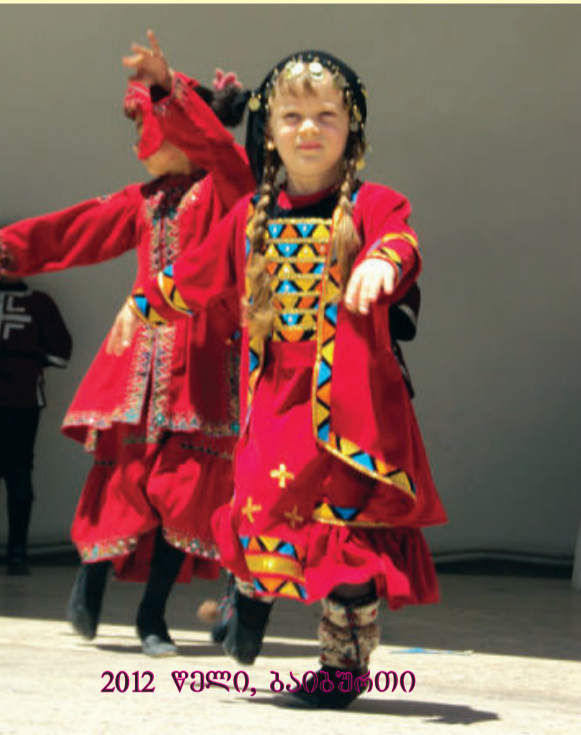
2012 წელი, ბაიბურთი

— აღნიშნული ფესტივალი არ ატარებს რაიმე საკონკურსო ხასიათს, რომ გამარჯვებულები გამოვლინდნენ. მისი მიზანია თურქი მაყურებელი აზიაროს მსოფლიო ხალხების ნაციონალურ კულტურას. აქედან გამომდინარე რაიმე განსაკუთრებული ჯილდო ჩვენთვის არ მოუციათ. ყველაზე დიდი ჯილდო ჩვენთვის ის დიდი სიყვარული და პატივისცემაა, რითაც ისინი გვხვდებიან ხოლმე ბაიბურთში. უნდა აღინიშნოს ისიც, რომ მათმა მხარემ ნაწილობრივ დაგვიფინანსა ბაიბურთსა და უკან მოგზაურობის ხარჯები. ბინთა და საკვებით კი ძირითადად მათ მიერ ვიყავით უზრუნველყოფილი. არა მგონია სხვა ქვეყნის წარმომადგენლებს მჭირდეთ იმდენი პატივისცემა და დაფასება, რითაც ჩვენი ანსამბლი სარგებლობს მათში. ვბრუნდებით უკან საგარეჯოში და მოგვაცილებდა ბაიბურთელი მაყურებლის გაღიმებულ ცრემლმორეული სახეები: — გაისად როდის ეწვევიან და გაახარებენ გურჯი პატარები თა-