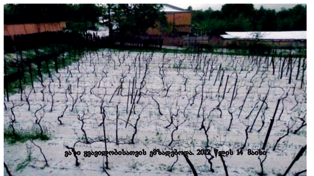
ვაზი ყვავილობისათვის ემზადებოდა. 2012 წლის 14 მაისი