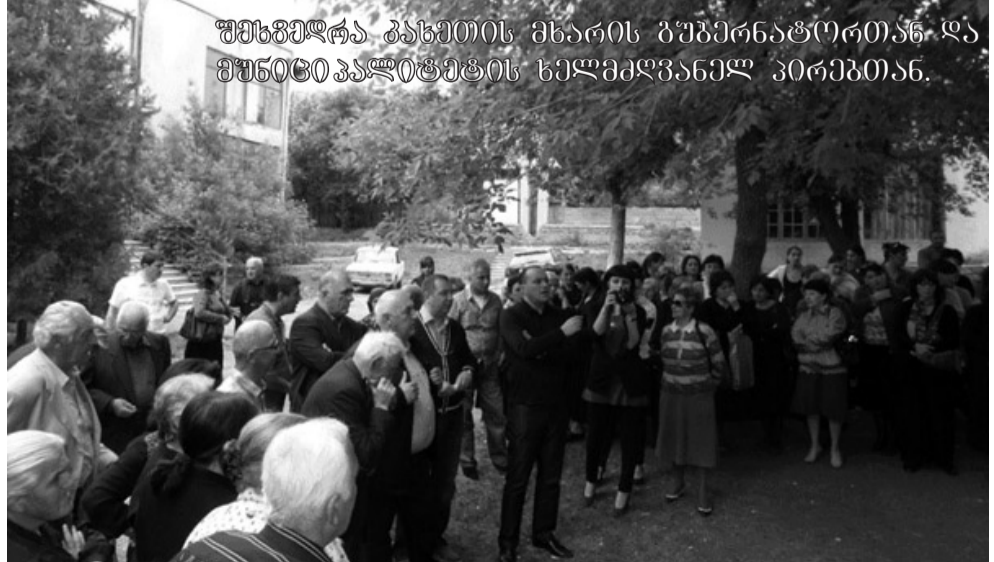
შენველრა კახეთის მხარის გუბერნატორთან და მუნიციპალიტეტის ხელმძღვანელ პირებთან.

ისე, ღვინოზე ვსაუბრობდით, ხაშმის საფერავზე, რომელიც იაპონელებმაც კი შეისყიდეს თურმე ხიროსიმასა და ნაგასაკე ატომური ბომბების აფეთქების შემდეგ - რადიაციის საწინააღმდეგოდ. რაც იმას ნიშნავს, რომ მას ონკოლოგიური დაავადებების საწინააღმდეგოდაც იყენებენ. გადმოცემით ვიცით, რომ ორსულ ქალს თვითონ ოჯახის წევრები გარკვეული დოზით აძლევდნენ, ამასთან ბავშვსაც, მოხუცსაც დადგენილი ნორმით. საფერავის ჯიშის ყურძნის სიტკბო 22 გრადუსზე არ აღის, სხვა შემთხვევაში