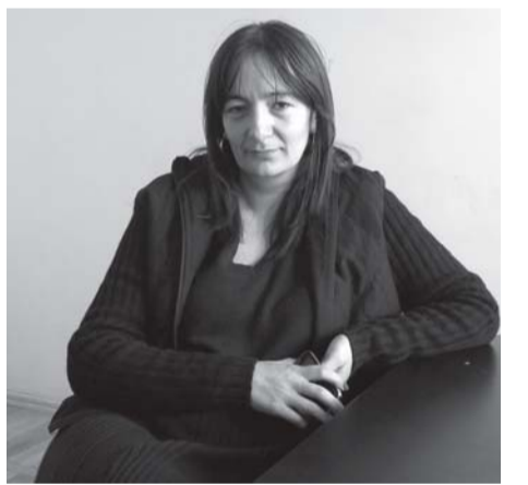
მელი წყლის უხარისხობის შესახებ.