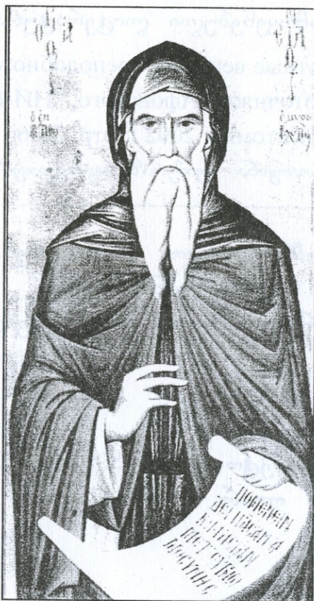
წმიდა ნილოს მთრონმდინარე (ათონელი)