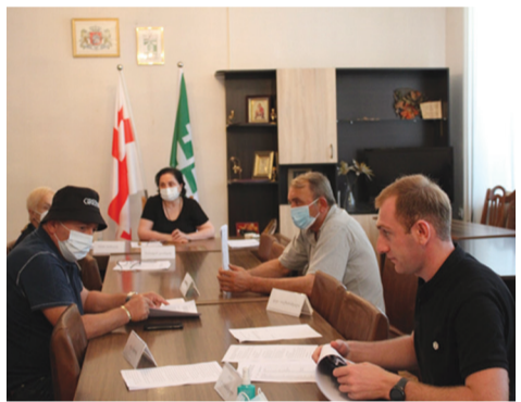
ჩაითვლება ის კანდიდატი, რომელიც არჩევნებში მონაწილე ამომრჩეველთა ხმების 40%-ზე მეტს მიიღებს.

ასევე, დამსხვილდა ოლქები და ხარაგაულის მუნიციპალიტეტში 20-ის ნაცვლად 11 სამაჟორიტარო ოლქი იქნება, რომლებიც შემდგენიარად განისაზღვრება: