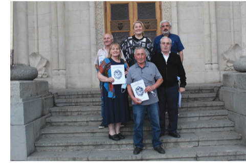
ალსანიშნავია, რომ ხარაგაულის სახელმწიფო თეატრს 120 წლის ისტორია აქვს.