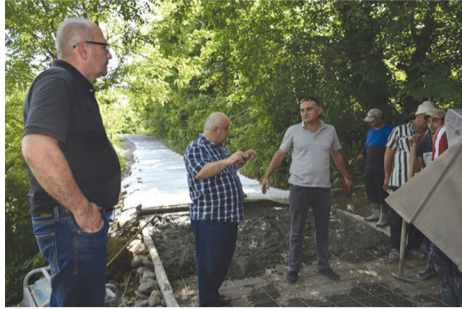
ვუნვეთ ამ პროცესს და ყველაზე მთავარია, მოსახლეობას დროულად და ხარისხიანად შესრულ

„მიუხედავად გზის რთული რელიეფისა, პროექტით გათვალისწინებული სამუშაოების 60 % უკვე გაკეთებულია. ჩვენ მონიტორინგს