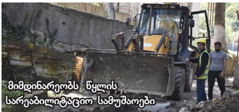
მიმდინარეობს წყლის სარეაბილიტაციო სამუშაოები

სულ მალე დაბისა და პატარა ხარაგაულის მოსახლეობა უწყვეტი წყალმომარაგებით ისარგებლებს. ამ მიზნით, სამუშაოები აქტიურ ფაზაშია. პროექტის ფარგლებში, რეაბილიტაცია უტარდება ლეღვის სათავე ნაგებობიდან შემომავალ 14-კილომეტრიან მაგისტრალს, რომელიც ასევე ითვალისწინებს წყალმომარაგების ქსელების, მაგისტრალების, ორი ახალი აუზის, ჭაბურღილების, სათავე ნაგებობებისა და სატუმბი სადგურის მშენებლობას. გარდა ამისა, მოეწყობა ახალი რეზერვუარი, დაგეგმილია კორპუსებში შიდა გაყვანილობის მოწყობა და მოსახლეობის ინ-