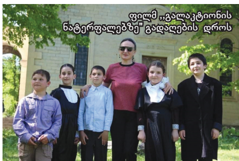
ფილმ „გალაკტიონის ნატერფალეზე“ გადაღების დროს