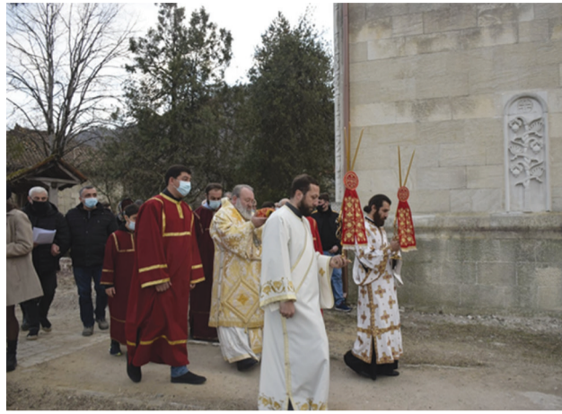
ხარაგაულის მრევლი, ადგილობრივი თვითმმართველობის წარმომადგენლები, ა(ა)იპ-ების თანამშრომლები, სხვადასხვა უწყებისა და ორგანიზაციის მსესურებელი. არ შეიძლება განსაკუთრებით არ აღვნიშნოთ იმ ადამიანების წვლილი, რომელთაც ნაკლები შეხება აქვთ ხარა-

ტაძრის მშენებლობაში აქტიურად იყვნენ ჩართული: