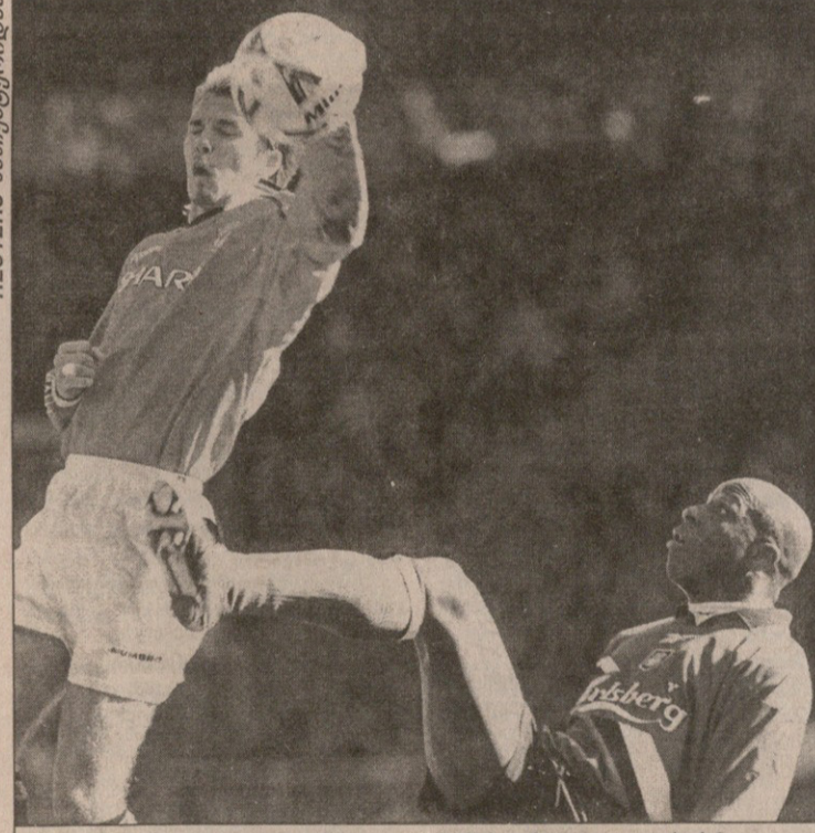
მანჩესტერი — ლივერპული 1:1. მანჩესტერელი დევიდ ბექემი და ლივერპული ტიტი კამარა (მარჯვნივ)