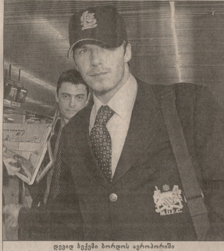
დევიდ ბექემი ბორდოს აეროპორტში

გაფრთხილებულინ ბორდო: ალიზი (2), დევიდ სოუზა (2), პეშე (2), ანჯელი, დრულოვიჩი, ლარო, სეკრეტარიუ ბარსელონა: აბელარდო (2), არანა, ბოგარდი, დანი, ფ. დე ბური, ფიგუ დისკვალიფიცირებულინ ბორდო: ფორფე კოშტა (1 მატჩი) ბარსელონა: არაგინ