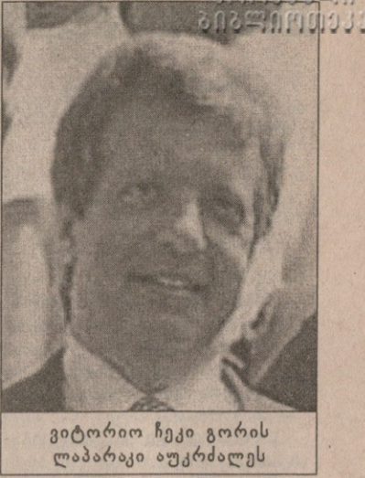
გიტორიო ჩეკი გორის ლაპარაკი აუტრიალეს

წინა ტურში, ამ გუნდების ბარსელონურ შეხვედრაში, „პორტუს“ ძალიან კარგად დაიწყო, მაგრამ 2:4 წააგო. მათ კარში ორი გოლი მსოფლიოს 1999-წლის საუკეთესო ფეხბურთელმა, რივალდომ გაიტანა და ეს პანელში ჯგუფის სათავეში მოექცნენ.