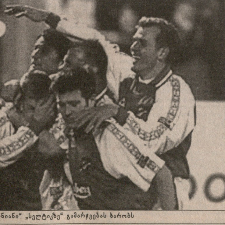
„ჰიბერნიანი“ „სელტიკს“ გამარჯვებას ხარობს

ნტეს“ საჯარიმოში საჯარო წყევლა მაგრამ მსაჯმა პენალტი არ დანიშნა.