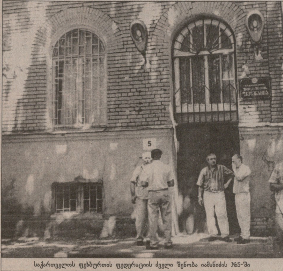
საქართველოს ფეხბურთის ფედერაციის ძველი შენობა იამანიძის №5-ში

იმ ათი წლის მანძილზე ფიფა-უეფას გაუუშინაურდით. ქართული გუნდები და ნაკრებები საერთაშორისო სარბიელზეც გვიხილავს. მართალია,