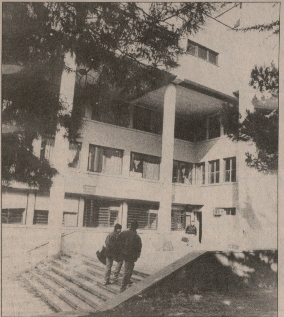
ფეხბურთის ფედერაცია ახლა სპორტის დეპარტამენტის შენობაში, მეორე სართულზე მდგმურობს