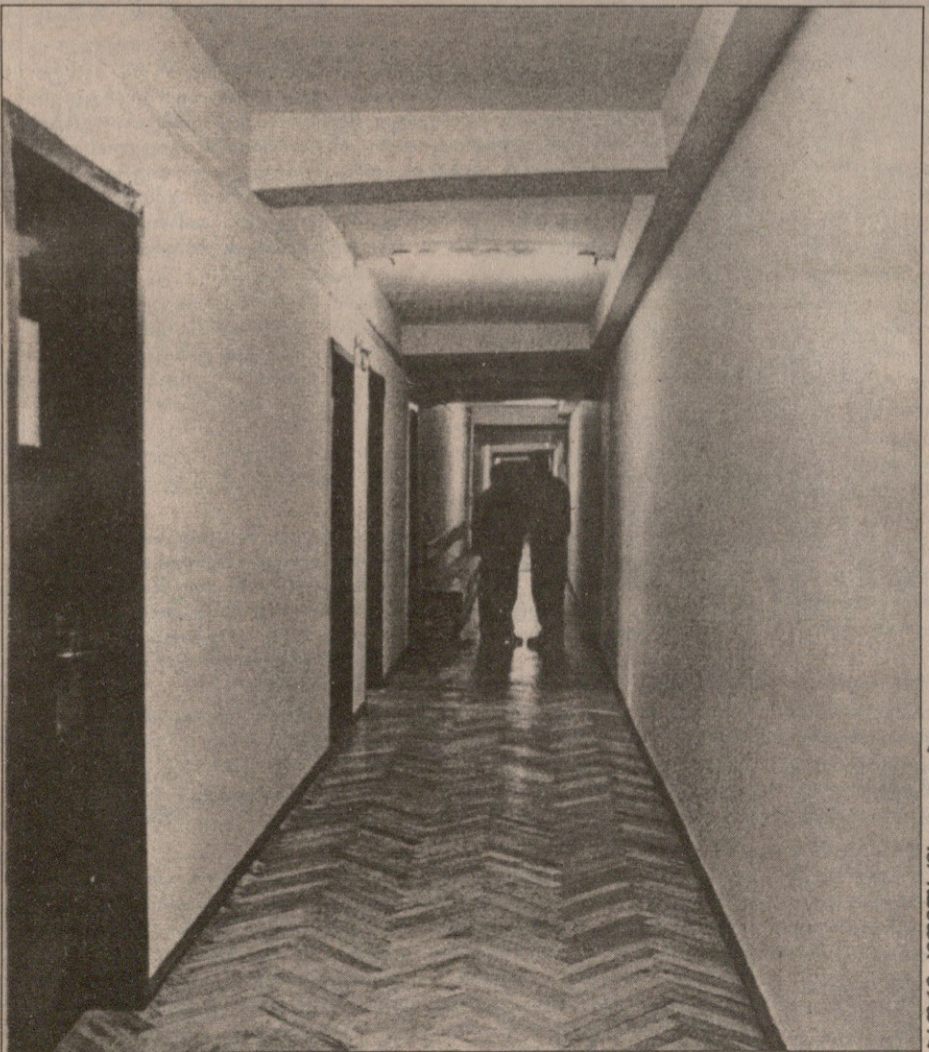
2000 წლის 15 თებერვალი. ქართული ფეხბურთის სახელისუფლო დერეფანში