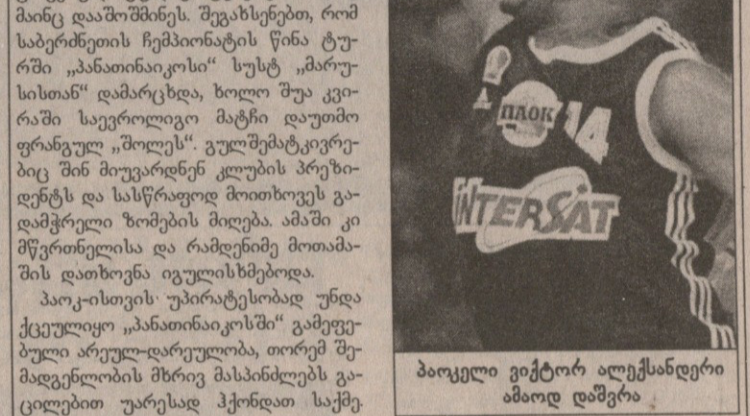
ბაოკელი ვიქტორ ალექსანდერი ამოოდ დაშვრა

ტურის ბოლო მატჩი კვირას გაიმართა და ტრადიცია არც მან დაარღვია. ევროლიგაში საფრანგეთის წარმომადგენელი „პო ორტეზი“ კიდევ ერთ ევროლიგელს, „შოლეს“ მასპინძლობდა. ევროტურნირის ბოლოსწინა ტურში პოლემბა მორიგი მარცხი იწვევს, თავიანთ ჯგუფში ბოლო ადგილი „გაინაღდეს“ და საფრანგეთს მომავალ სეზონში ევროლიგის ერთი ადგილი დააკარგვინებს. სამაგიეროდ, „შოლე“ ივანოვიჩი, ბებერი კონტინენტის ერთ-ერთი საუკეთესო გუნდი, საბერძნეთის „პანათინაიკოსი“ დაამარცხა და მართალია, მერვედღიანში ვერ გააღწია, მაგრამ არც ბოლო ადგილზე გავიდა. შინურ ჩემპიონატშიც ორივე გუნდმა იგივე შედეგს მიაღწია. „პო ორტეზი“ ზედიზედ მეხუთედ დაამარცხდა, რაც საფრანგეთის ჩემპიონის ისტორიაში პირველი შემთხვევაა.