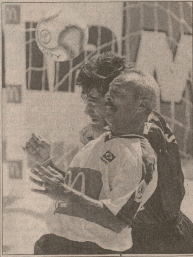
REUTERS რიო დე ჟანეიროდან

მუქქვს მხოფლითს ჩემპიონატი მიმდინარეობს. ბრაზილიელთა კაპიტანი, სახელთოვანი უუნთორი მავან იტალიელ ფეხბურთელს ებრძვის. ამ შეხვედრის შედეგი ჩვენთვის ცნობილია, ბრაზილიელებმა 10-4 მოიგეს. ფილიპინებზე კი ქალთა საპლაჟო ფრენბურთი გახურებულა. ავსტრალიელი გოგონები ცდას არ აკლებენ, რომ იაპონელები დაჯაბნონ, მაგრამ ბევრი არაფერი გამოთუდით.