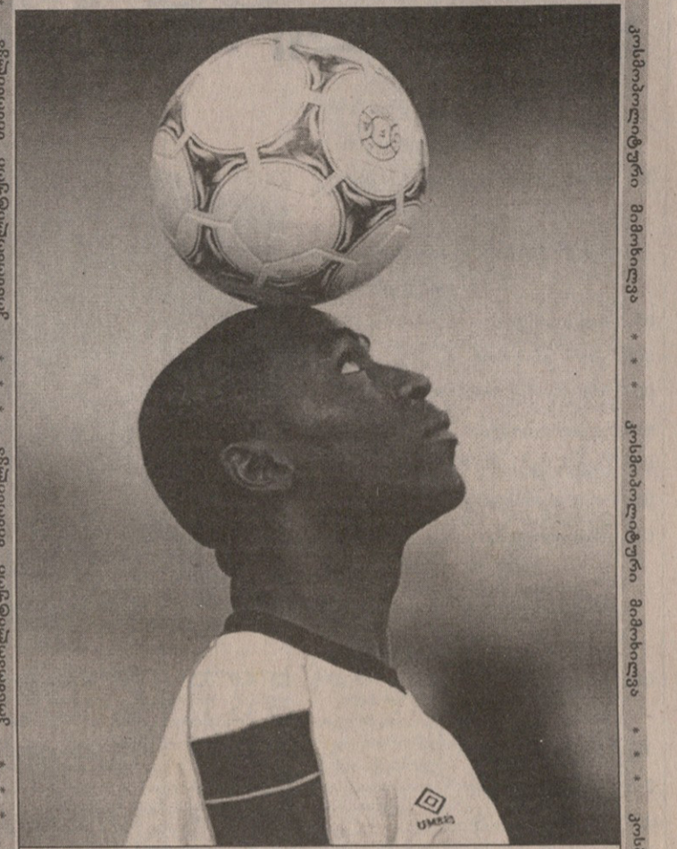
ინგლისში კოლუმბის გვარი მეტამეტე საუკუნიდან მოდის