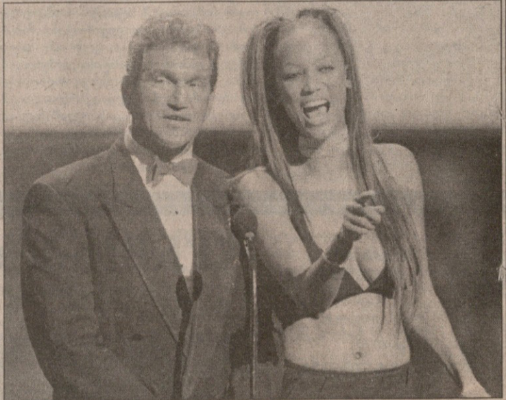
REUTERS ლას ვეგასიდან

ათნლეულისანი ლას ვეგასში ათნლეულის ჯილდოთა გადაცემის დიდი ცერემონილი ვაიმართა. მთელი ამერიკის უგანთეშულესი სპორტსმენები იქ იყვნენ შეყრილნი და ნაირგვარ ჯილდოებს იღებდნენ „ემჯიემ გრანდ არენას“ დარბაზში. შოუც ფრიადი იყო, სუპერმოდელი ტაირა ბენქსი ისე იცინოდა, გვეგონებოდათ თავად იღებს პრიზს, ვანთეშულ მობურთალ ჯო ტისმენისგანო. თუმც კი, მაიკლ ჯორდანისა და უეინ გრეცკის გამოჩენა ყოველგვარ შოუს ჩრდილავს. ჯორდანმა და გერციკიმ სავანგებო პრიზები მიიღეს, ჯორდანმა კი ათნლეულის ათლეტის თასიც დაისაკუთრა.