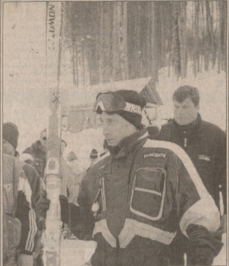
კრასნაია პოლიანიდან

სპორტსმენი კარგახანია, რუსეთს არ ყოლია სპორტული პრეზიდენტი. სადაც კი რაიმე წუთს