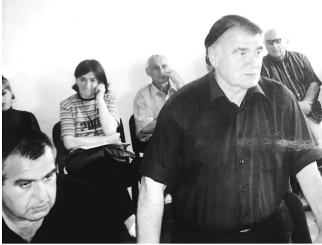
„კოლხეთის“ 85 წლის იუბილე, 2008 წ.