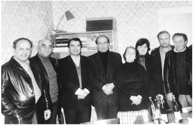
მშენებლის დღე რედაქციაში, 1984 წ.