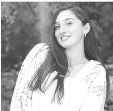
ლილი გვარამია №1 საჯარო სკოლა -თბილისის სახელმწიფო უნივერსიტეტი - ფაკულტეტი საერთაშორისო სამართლის ფაკულტეტი - 70 % გრანტი