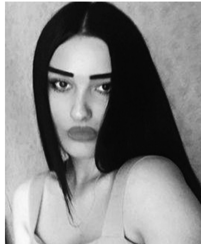
მაია ქობალია №7 საჯარო სკოლა, თბილისის ივანე ჯავახიშვილის სახელობის სახელმწიფო უნივერსიტეტი, სამართლის ფაკულტეტი 70 % გრანტი