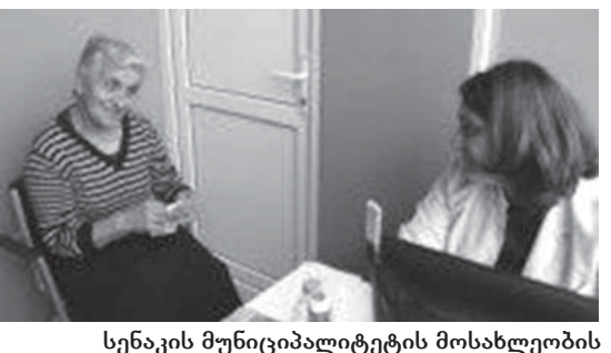
სენაკის მუნიციპალიტეტის მოსახლეობის სახელით კიდევ ერთხელ გვინდა მადლობა ვუთხრათ მათ.