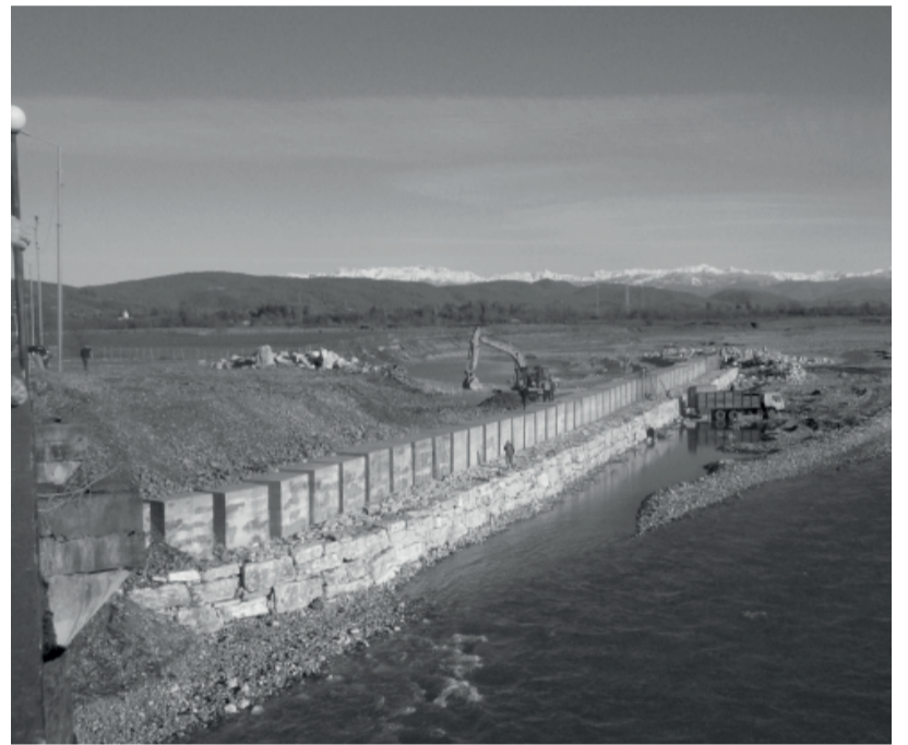
ნაპირსამაგრი მდინარე ტეხურზე