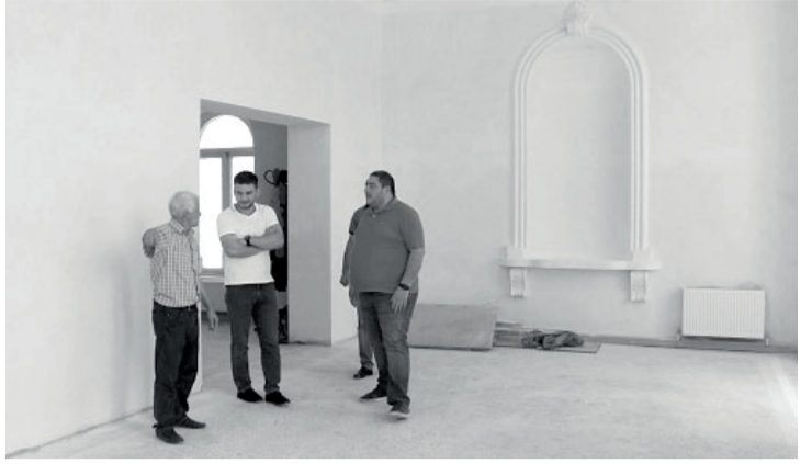
მუნიციპალიტეტის მერიის საზოგადოებასთან ურთიერთობისა და საინფორმაციო უზრუნველყოფის სამსახური