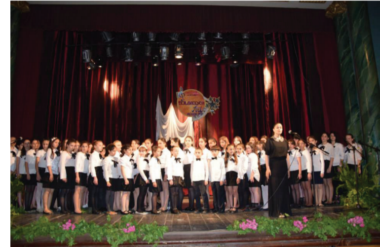
სენაკის საშუალო სკოლის ვაქლი