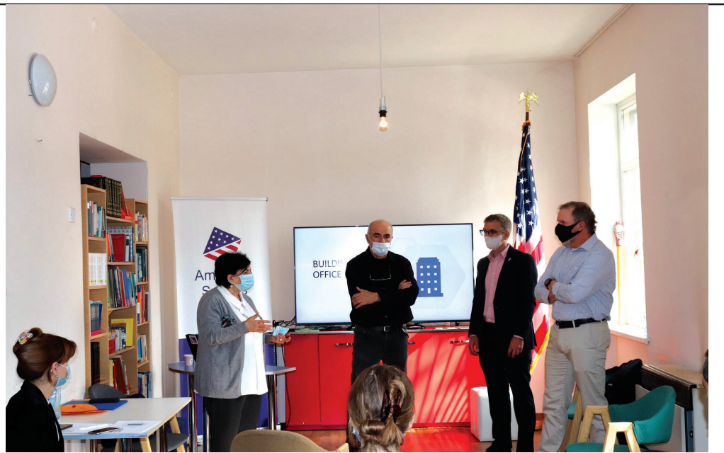
შეხვედრის ბოლოს განხილული იყო სამომავლო თანამშრომლობის პერსპექტივები.

შეხვედრაზე საუბარი შეეხო საევაკუაციო გეგმის მნიშვნელობას, უსაფრთხოების იმსტანდარტებს, რასაც ამერიკის შეერთებული შტატები აწესებს შენობების დაგეგმარების პერიოდში. განსაკუთრებული აქცენტი გაკეთდა დასაქმებულთა პერსონალურ განვითარებასა და პირად პასუხისმგებლობაზე უსაფრთხოების უზრუნველყოფის საქმეში წვლილის შეტანაში.