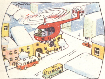
9. ვერტმფრენი დაეშვა ზაქარას კა-ლაქში, იქ უკვე დაშაშორებულყო.

— მე თუთიყუშს მეძახიან,—დიწყო ჭრელმა ჩიტმა,—ცხელ ქვეყნებში ვცხოვრობ, ამ ნემს