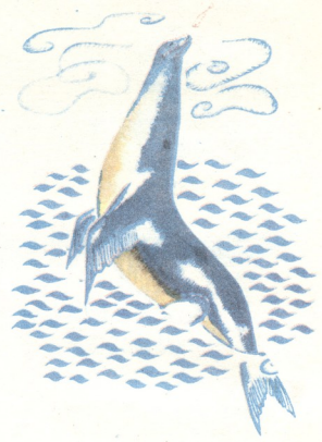
ნახატი ლორეა მენელიანი