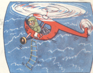
6. იღბლად ვერტმფრენი გამიჩინდა.