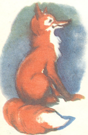
ნახატი ლემარა ლანელიანი

მურიკელამ ჩაიცინა: «გაახარე ქათმებო;—წამოზრძანდი, წამოზრძანდი, ფერმის კართან დაგხვდები!»