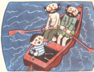
2. სამიღენი ნავში ჩასბდენ და გასცურეს.