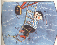
7. მფრინავმა თოქის კიბე ჩამოუშვა და ზაქარა ზედ აბობლდა.