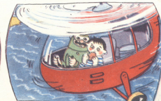
8. მფრინავმა იჩაქათამოლიერული ზაქარა დაიწარა და მოასვენა.