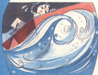
5. გულვახეთქილი ზაქარა ნავის კიდეს ჩაებღაუტა, ის-ის იყო უნდა დაღუბულიყო, რომ...