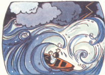
4. ზღვაზე კარიშლი ამოფარდა და ნავი ნაფოტით ვიტაცა.