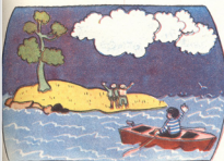
3. აჩარა და პაჩარა თავიანთ კუნძულზე ვაღმოვიღენ და ზაქარამ გზა ვანაგრძო.