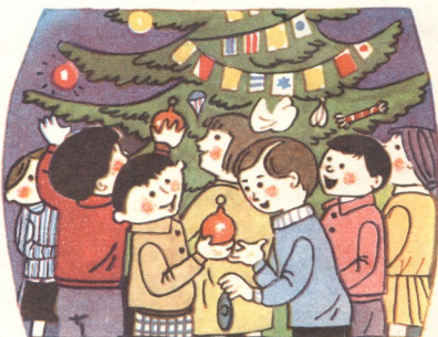
10. ზაქარას მეგობრები საახალწლოდ ემზადებოდნენ.