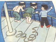
1. შულამისას ზაქარამ აჩარა და პაჩარა აინიდან აბნა.