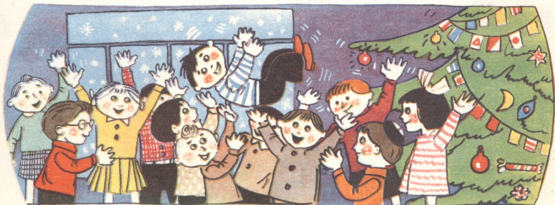
11. ისინი ზაქარას გამოჩენას აღტაცებით შეხვდნენ. ზაქარამ თავისი თავ-