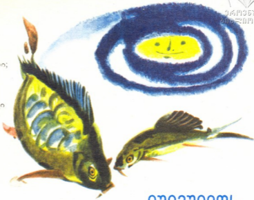
ნახატები შიჩაქო კანაქისა