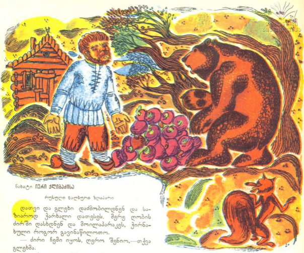
ნახატი ივრი ძლიზაძისა