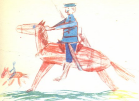
1. „ცხენახნები“ — ნახატი იაკლი როსტომიშვილისა, 5 წ. თბილისი.