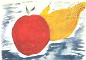
2. „ნატურმორტი“ — ნახატი ზურაბ მიქელაძისა, 11 წ. თბილისი.