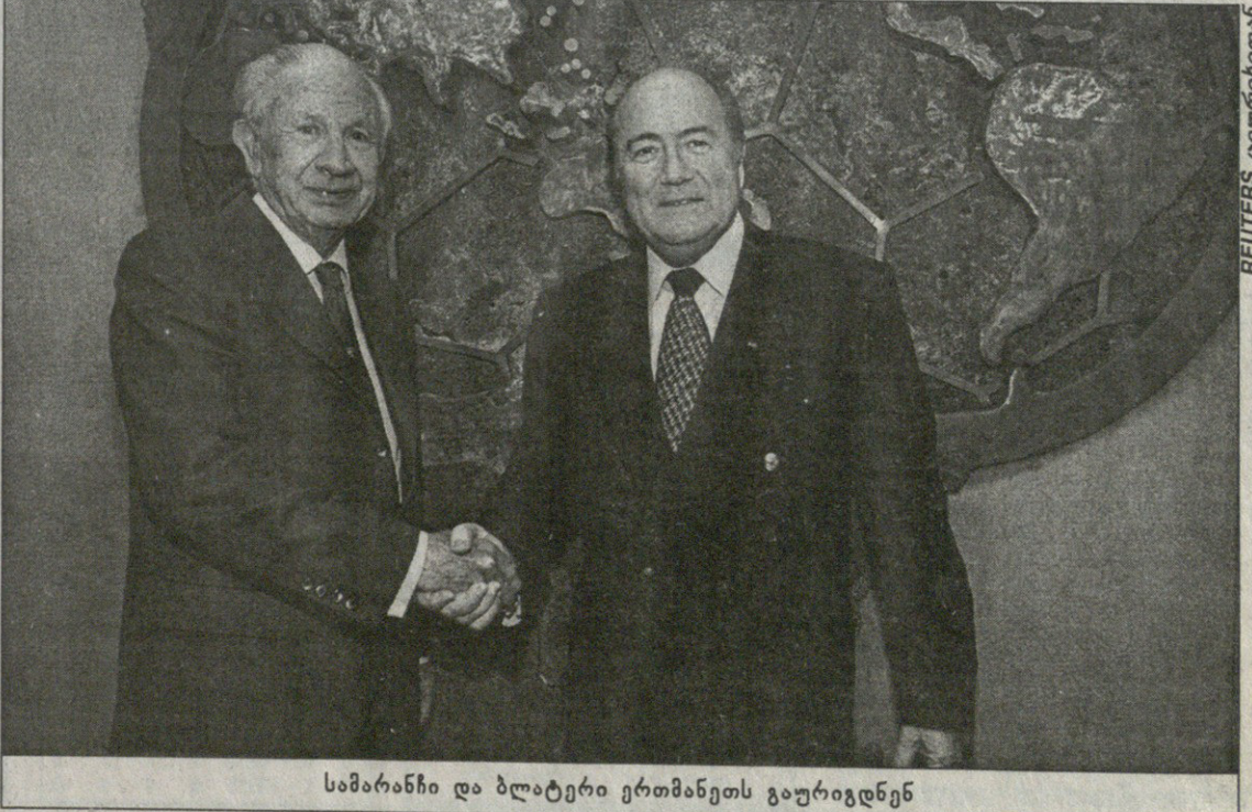
სამარანჩი და ბლატარი ერთმანეთს გაურიდნენ

„სისულელეა“ — თქვა ბლატარის დაჟინებაზე უფას პრეზიდენტმა ლე-ნარტ იუჰანსონმა. მისი ინტერვიუ გე-რმანულ „შპიგელში“ გამოქვეყნდა. „ჩვენ მსოფლიოს უდიდეს შეჯიბ-რებას ფასი არ უნდა დაგუქარგოთ, თორემ მივიღებთ პოკეის ჩემპიონატის მაგარ სანახაობას, რომელსაც ყოვე-ლწლიურად არავინ უყურებს. ასეთი სიხარბე დაუშვებელია“ — განაცხა-და მან და დასძინა, რომ ორწლიანი ციკლი საქმეს ისე არეგს, რომ ველ-არავინ შეძლებს ნამდვილი A ნაკრე-ბის გაყვანას შეჯიბრებაზე. „კიდევ“ — განაცხადა იუჰანსონმა — „შესაძლოა ისე მოხდეს, რომ მსო-ფლიოს ყოველ მეორე ჩემპიონატში ევროპულმა გუნდებმა მონაწილეობა