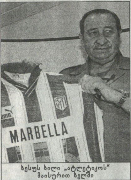
ხესუს ხილი „ატლეტიკოს“ მაისურით ხელში

„მარბელა მხარს უჭერს თავის მერს“ — ეწერა ერთ პლაკატზე.