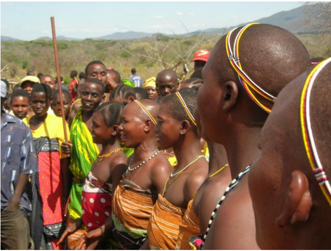
ვაგოგოს ტომი ემბეში (დოდომას რეგიონი)

კომპლექსურია: იყენებენ პოლიფონიის ისეთ ტიპს, რომელიც შედგება მრავალხაზოვანი ტექნიკის სხვადასხვა სახეების კომბინაციებისაგან. ამ თუ იმ ვითარებაში, რიტუალსა და დასვენებას შორის მუსიკა ხდება სოციალური ერთობის არსებითი ფაქტორი. მათი მუსიკის პოლიფონიური კონცეფციის თვალსაზრისით, საინტერესოა იმის ცოდნა, რომ ვაგოგოს ლექსიკაში განსხვავდება უბრალოდ „სიმღერა“ – კვიმბა (მიუხედავად იმისა, იდენტურია თუ არა ორი ან მეტი ხმის რიტმული არტიკულაცია) და „პოლიფონია“ – სილუმი (განაწილება), ასე ვთქვათ, რიტმულად დამოუკიდებელი ვოკალური ხაზების ზემოთ აწევა სემანტიკური მნიშვნელობის არმქონე მარცვლების გამოყენებით.