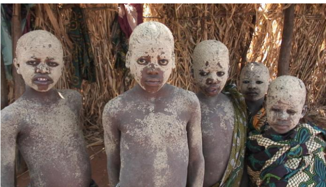
ვაგოგოს ბავშვები მაკუმბის ინიციაციის რიტუალის დროს.

კომპლექსურია: იყენებენ პოლიფონიის ისეთ ტიპს, რომელიც შედგება მრავალხაზოვანი ტექნიკის სხვადასხვა სახეების კომბინაციებისაგან. ამ თუ იმ ვითარებაში, რიტუალსა და დასვენებას შორის მუსიკა ხდება სოციალური ერთობის არსებითი ფაქტორი. მათი მუსიკის პოლიფონიური კონცეფციის თვალსაზრისით, საინტერესოა იმის ცოდნა, რომ ვაგოგოს ლექსიკაში განსხვავდება უბრალოდ „სიმღერა“ – კვიმბა (მიუხედავად იმისა, იდენტურია თუ არა ორი ან მეტი ხმის რიტმული არტიკულაცია) და „პოლიფონია“ – სილუმი (განაწილება), ასე ვთქვათ, რიტმულად დამოუკიდებელი ვოკალური ხაზების ზემოთ აწევა სემანტიკური მნიშვნელობის არმქონე მარცვლების გამოყენებით.