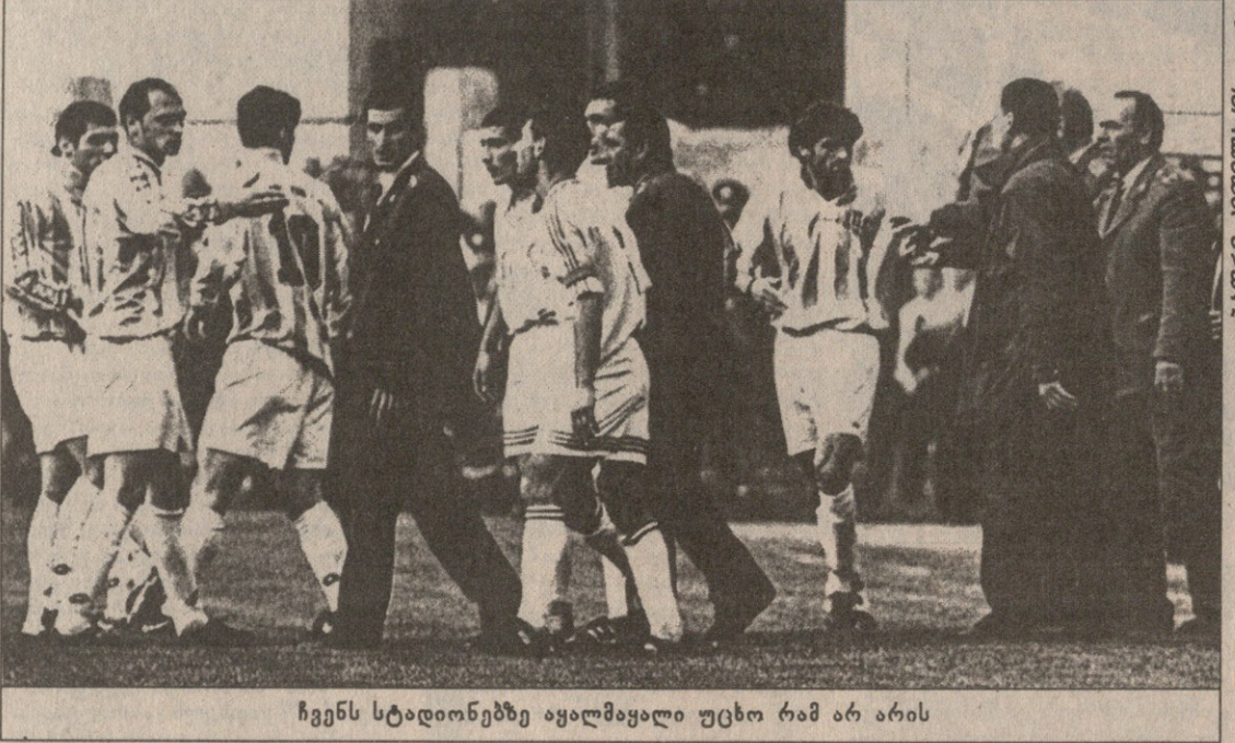
ჩვენს სტადიონებზე აყალიბდა იტხობ რამ არ არის

უმეტეს, როცა ნიკას ყველა თავდაჭერილ და პატიოსან მოთამაშელ ვიციობო. ბათუმი მეკარე დასაჯა. ფედერაციამ წლის ბოლომდე დისკვალიფიკაცია და სეზონის ბოლომდე პირობითი დისკვალიფიკაცია დაუდგინა, მაგრამ თავისი ბოლომდე მინც არ გაიტანა. თუ ფეხბურთელს დასჯი და მსაჯზე ხელყოფის ფაქტს აღიარებ, მაშინ დებულების თანახმად „ბათუმის“ უნდა დასჯილიყო. კერძოდ, ბათუმელთათვის სამი ქულა უნდა ჩამოეკლოთ.