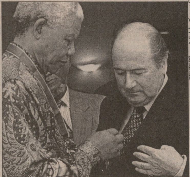
ნელსონ მანდელა და იოზეფ ბლატერი იოჰანესბურგში შეხვედრისას

ნტზე ჩატარება ამ პროცესს დიდად შეუწყობს ხელს. გვეჯერა, რომ ფიფა და მისი თავიანთი მოწყობის თვალთი გადმოგვხედავენ — მიმართა ბლატერს მანდელს — ეშმაკური ღიმილით დაამატა, ჩემი სამუშაო გრაფიკი ძლიერ გადატვირთულია, ერთადერთი, რითაც ახლა შემიძლია პატივი დავგლოთ, ერთად სურათის გადაღებააო.