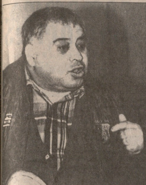
გიორგი მორდაკიძის თქმით, ნაკრების შემადგენლობის ოთხი მწვრთნელი ასახელებდა