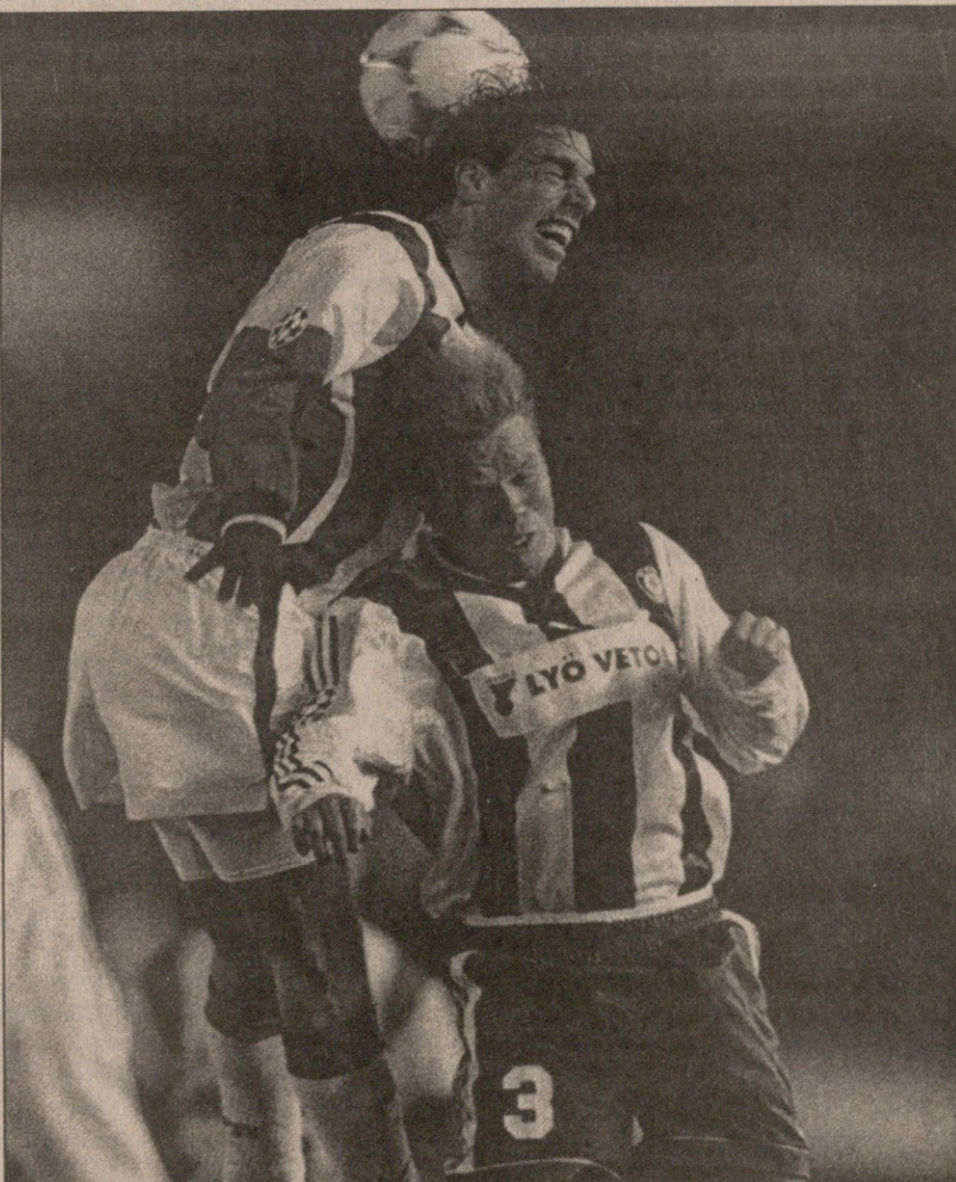
ჰიპ — ეინდჰოვენი. ვან ნისტელროისა და ტურბინენის (№3) საპირო ორთაბძოლა

აქსანიშნავია, რომ ლისაბონელმა გულშემატკივარმა ბოლოხანს კლუბზე გული აიცრუა, რაც ოთხამათს ნათლად გამოჩნდა — სტადიონზე მხოლოდ 20 ათასი კაცი მივიდა.