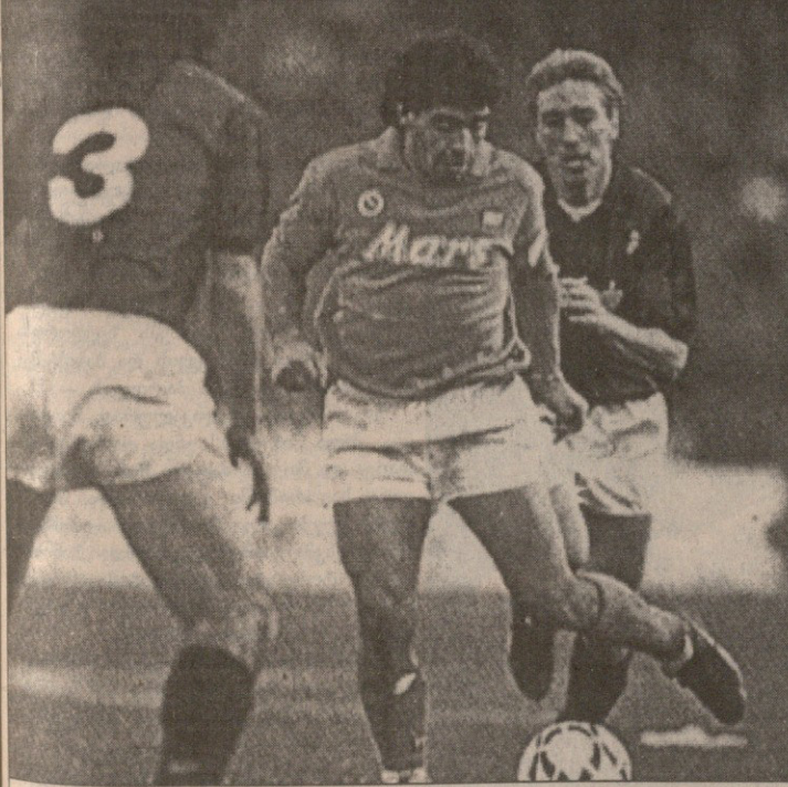
დიეგო მარადონა 1984-91 წლებში „ნაპოლიში“ თამაშობდა

რა პატარაა მსოფლიო. კაცი რომ იტალიაში რადაცას იტყვის, არგენტინაში ექოა. ათასჯერ გამეორებულ ისტორიას თავიდან აღარ მოგვხვებოდა. როგორ თქვა გასულ ზაფხულზე, საგანგებო ინტერვიუში „რომას“ ჩემმა მწვრთნელმა ზინედინ ზიდანმა იტალიის საფეხბურთო ლიგის დიპლომატიის, ყველამ კარგად იცის. ცნობილი ვაგრობებაც დაიწყო გამოძიება და რომში მოქმედი საგანგებო ლაბორატორიის საქმიანობას ჩრდილი მიადავა. ოქტომბერში ლაბორატორია დახურეს. ეჭვობენ, რომ მისი თამაშის დროს აქა-იქ ანალიზის შედეგებს აყვავდებდნენ.