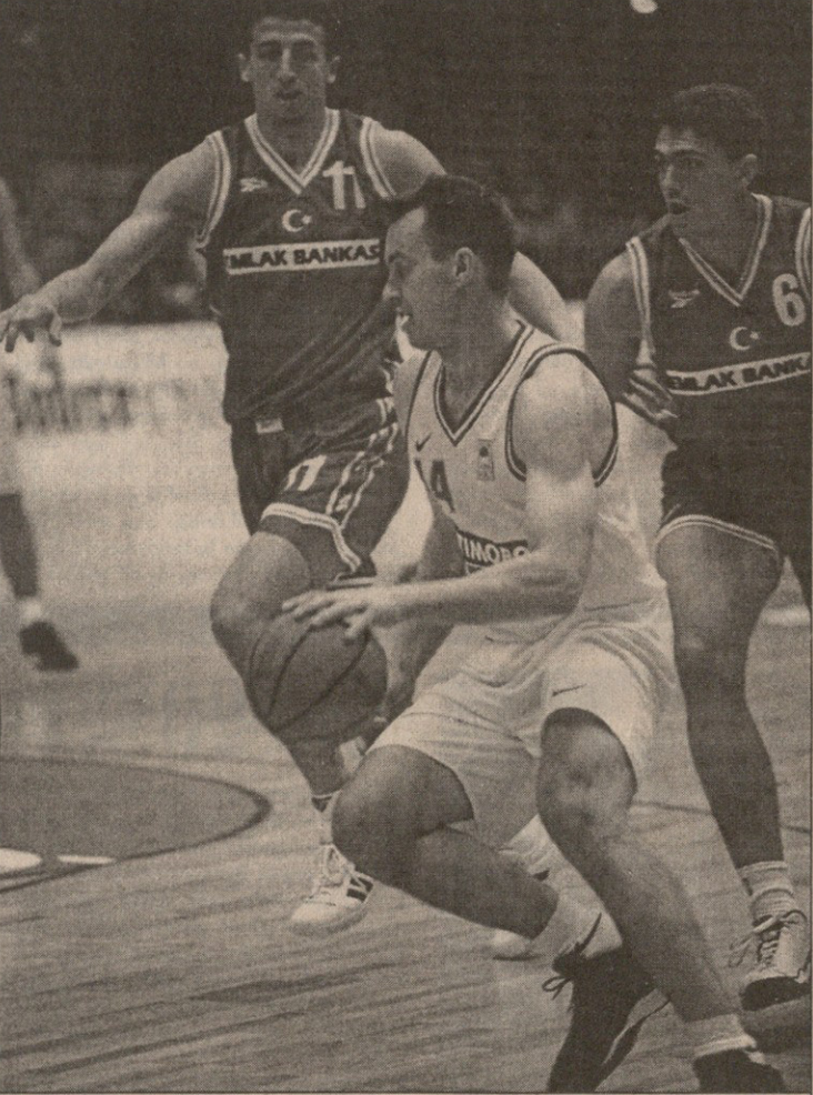
შედეგით — თურქეთი. შვედი პერ სტრიუმერი (ბურთით) ოთხშაბათს თურქებს უტეგდა, ხვალ ჩვენთან შეეცდება იგივეს

თავისთავად ამ დროს ბევრი იქნებოდა დამოკიდებული ფლენტსა და აბრამიძეზე. რომელთაც მსგავსი შეხვედრების წარმ-რთვის არანაირი გამოცდილება არ ჰქო-ნდათ. ეს, თავის მხრივ, ემოციებსაც გამო-იწვევდა და თამაშის ხარისხზეც იმოქმე-დებდა, რადგან ამას მნიშვნელოვნად სწორედ გამოამაშებელი განაპირობებს.