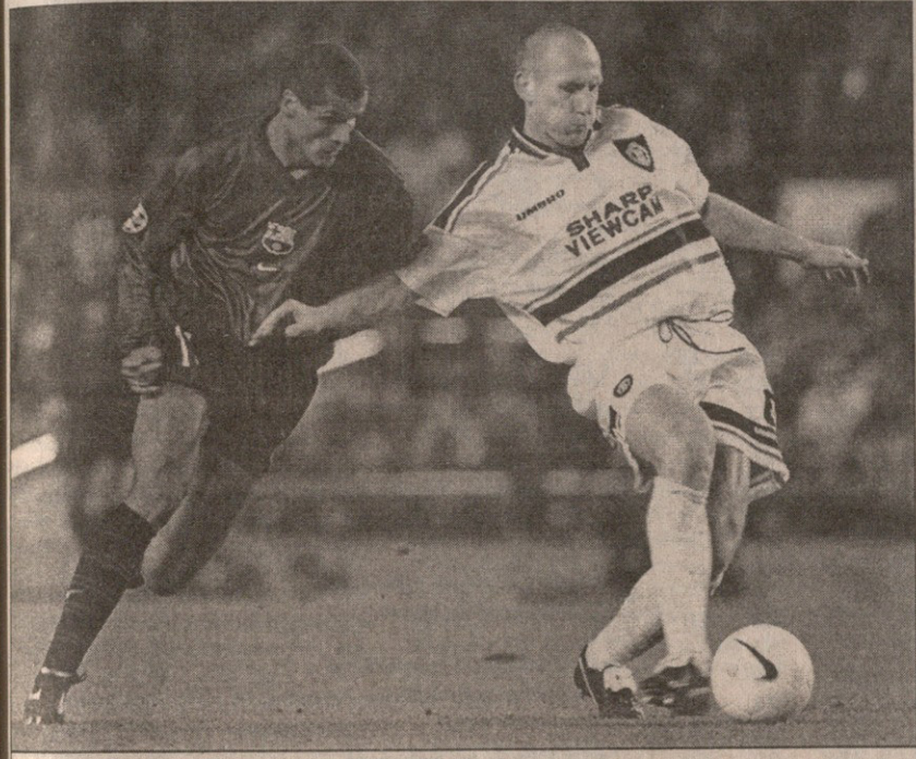
ბარსელონა — მანჩესტერი. შეუდარებელი რივალდო (მარცხნივ) და იაბა სტამი