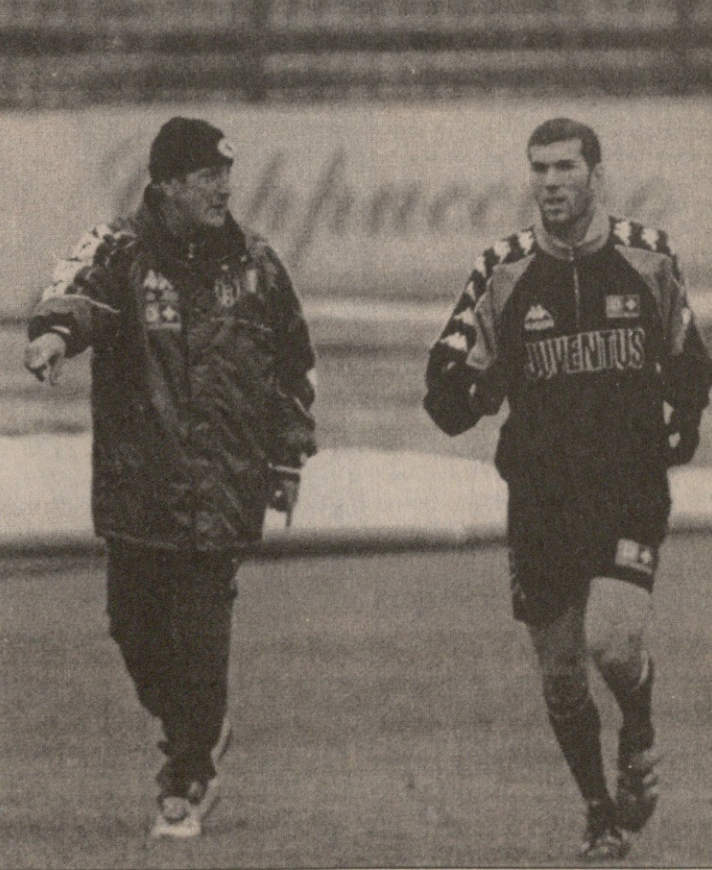
მარჩელო ლიპის და ზინედინ ზიდანს სტამბოლში წასვლა არ სურთ

ბრაზილიელი მწვრთნელი კარლოს ალბერტო პარეირა, რომლის თავიანთობაც 1994 წელს ბრაზილიის ნაკრები მსოფლიოს ჩემპიონი გახდა, შესაძლოა, სამხრეთ აფრიკის ეროვნულ გუნდს ჩაუდგეს სათავეში. იგი ახლაც იოჰანესბურგში იმყოფება ფეხბურთის ფედერაციის წარმომადგენლებთან მოსალაპარაკებლად. სააგენტო „როიტრის“ ჟურნალისტს მან შემდეგი განუცხადა: „უახლოეს დღეებში შინ დავბრუნდები და კარგად გავაანალიზებ ყველაფერს. სასურველია შესაძლებელია ამ საქმეს ხელი მოვიკიდო, ვინაიდან დიდი ხანია, ვაკვირდები აქაურ ფეხბურთელებს და მათში დიდი პოტენციალი დავინახე უბრალოდ, მათ გამოცდილება აკლიათ.“ სამხრეთ აფრიკის ნაკრების მთავარი მწვრთნელის პოსტიდან ფილიპ ტრუსიეს წასვლის შემდეგ ქვეყნის ფეხბურთის ფედერაციამ მრავალი კანდიდატურა განიხილა, მაგრამ პარეირას ვიზიტის შემდეგ უპირატესობა ამ უკანასკნელს მანიჭა. ყველაფერი უახლოეს მომავალში გაირკვევა.