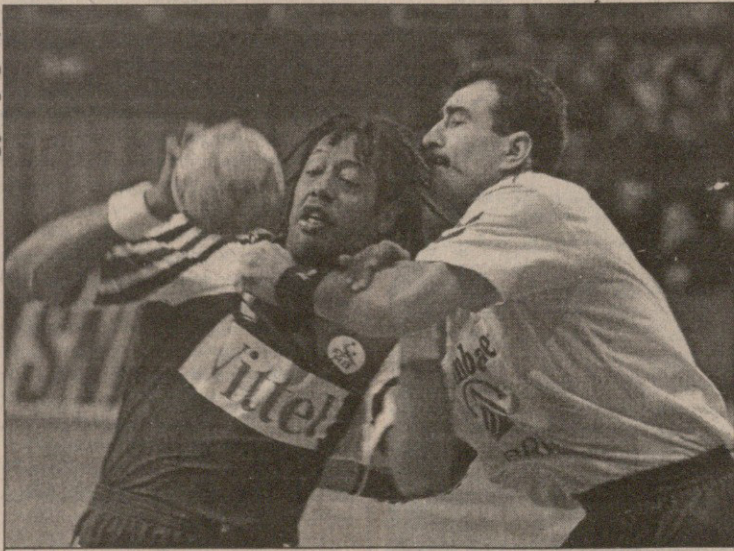
ხელბურთელ ვაეთა მსოფლიოს ჩემპიონატის შესარჩევ მატჩში რუმინეთმა ფრანგებს უმასწინძლა, მედგრადაც იბრძოლა, მაგრამ 22:20 გამარჯვებით მაინც სტუმრებმა იხარეს. ამ სურათზე ფრანგთა ცნობილი მოთამაშის ჯეკსონ რინარდსონისა (პურითი) და რუმინელი ლეონარდ ბიბირიგის ორთაბრძოლაა აღბეჭდილი