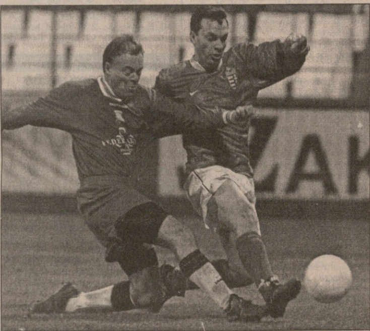
ეს არ არის ვეტერანთა მატჩი, ეს სამთავრობო შეხვედრება. უნგრელმა და ბრიტანელმა პარლამენტარებმა ბუდაპეშტში 1993 წელს „უემბლიზე“ უნგრელითაგან ინგლისზე წმ ისტორიული გამარჯვების 45 წლისთავი აღნიშნეს. ფოტოზე უნგრეთის პრემიერ მინისტრი ვიქტორ ორბანი (მარცხნივ) ბრიტანელ პარლამენტარ კლაივ ბეტსს ებრძვის. ისევე როგორც 45 წლის წინათ, ამჯერადაც უნგრეთმა მოიგო, ოღონდ 2:0